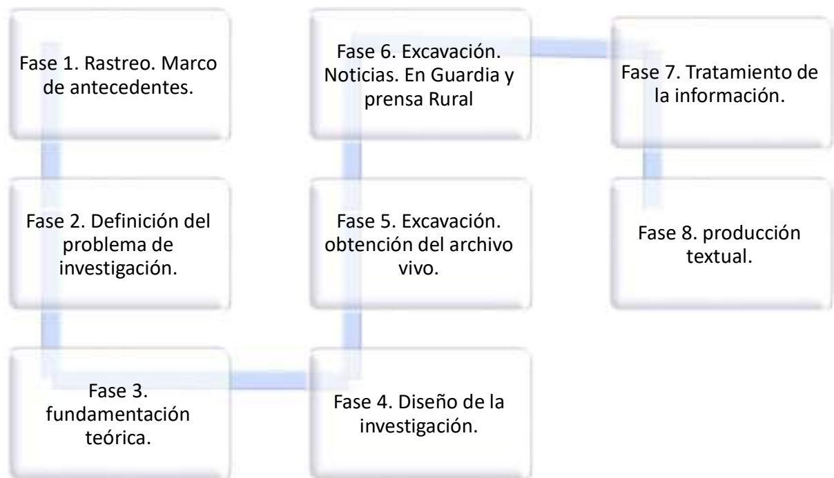
Gráfica. N. 1. Fases de la investigación.

Para finalizar se elabora un capítulo de cierre, que describe de manera puntual aquellos aspectos relevantes durante el proceso de la investigación, tales como las dificultades, obstáculos, pertinencias y aciertos en el cada uno de los momentos del ejercicio investigativo, expresado en una lectura contextual actual del panorama nacional.