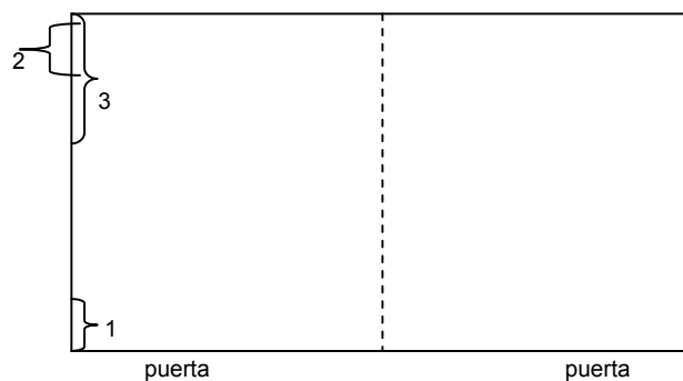
Diagrama 1: Distribución básica de los cubículos

Se realizaron en cubículos de 4.50 x 3 mts. En algunas situaciones, el cubículo era acondicionado a la mitad (-----). En cada cubículo está instalada una cámara (1) de video a control remoto (CCTV: Cámara Evetar, EVD06060M, zoom 6-60mm. Y lente 1:1.2), a una altura de 1,80 mts.; ocasionalmente, se integró una cámara de video Handycam (2), DCT-TRV 350 marca Sony, desde los espejos unidireccionales (3) de observación (0.90 x 0.60 mts., a una altura de 1.10 mts.) de cada cubículo; cada cámara tiene su propio sistema de grabación en VH y de recepción en TV, con capacidad de hacer trasmisión en tiempo diferido o real; igualmente ocurre con el sistema de sonido. (Ver Diagrama 1 )