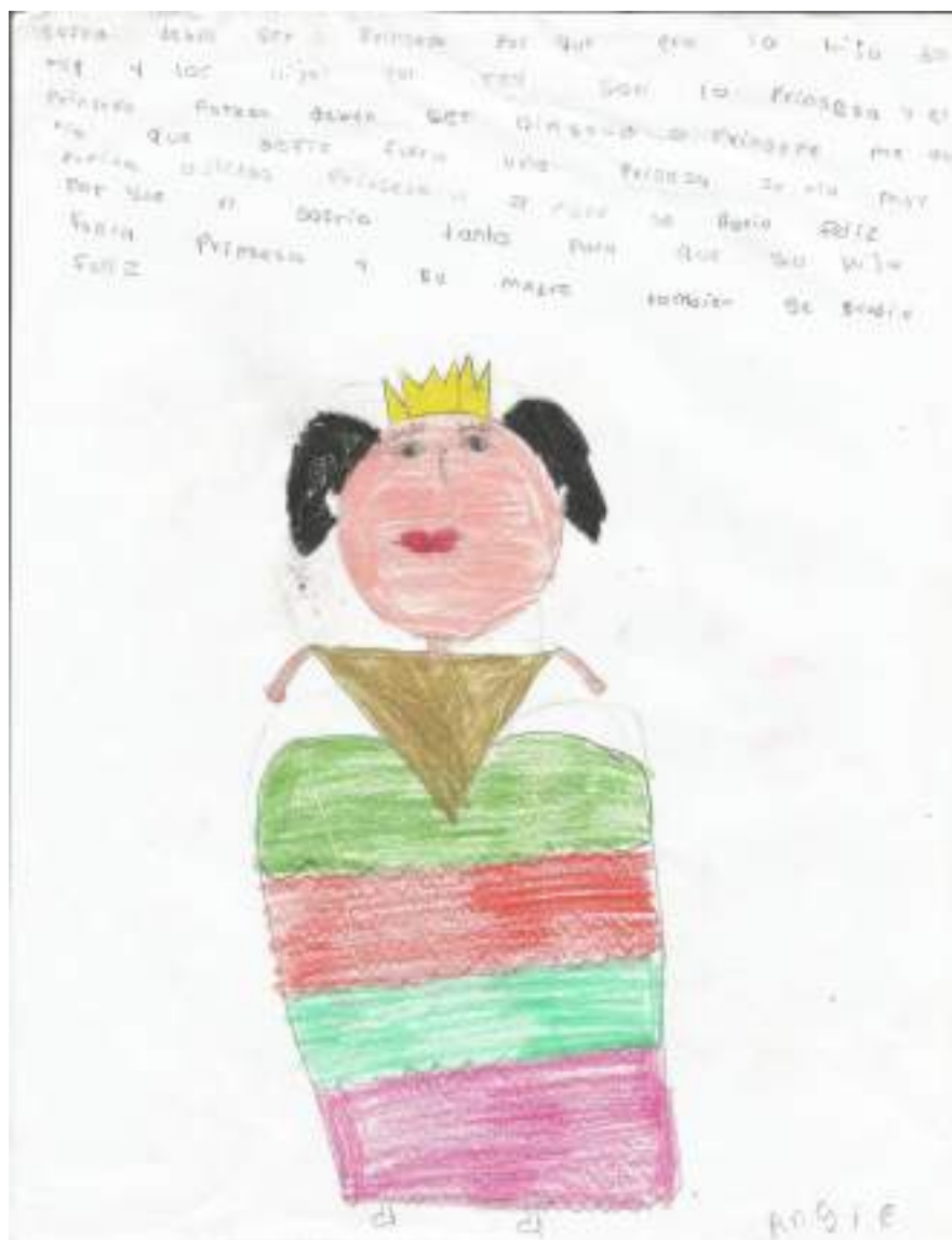
Figura 2. Dibujo de la princesa Sofía realizado por Angie.

En el segundo dibujo se observan similares elementos al anterior, la niña que lo elabora considera que la “la princesa” debe comportarse de determinada forma debido a su condición de hija del Rey, es decir, casi de forma causal define el rol de la hija.