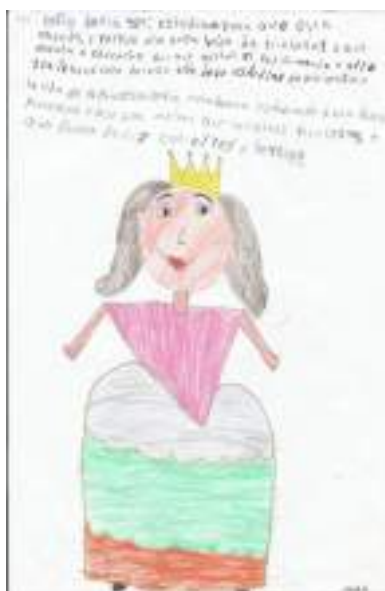
Figura 1. Dibujo de la princesa Sofía hecho por una estudiante de la escuela rural.

En la primera imagen se pone en evidencia la influencia de los discursos sobre la importancia de educarse, de lograr la felicidad como un fin a partir de ser “una buena estudiante y una buena princesa”.