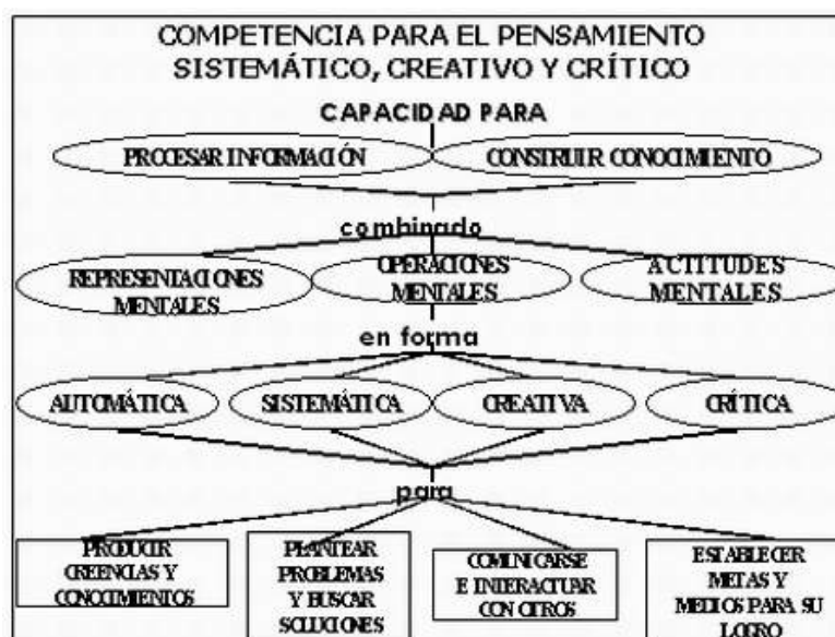
Cuadro No 13-Competencias para el pensamiento, sistemático, creativo y crítico