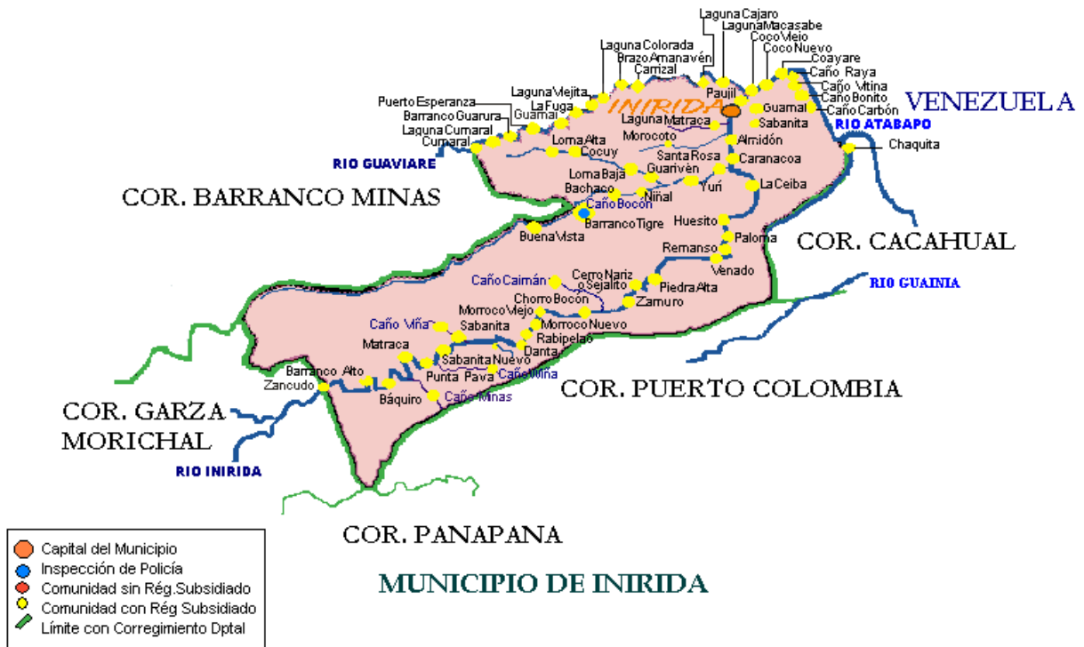
MAPA No. 1