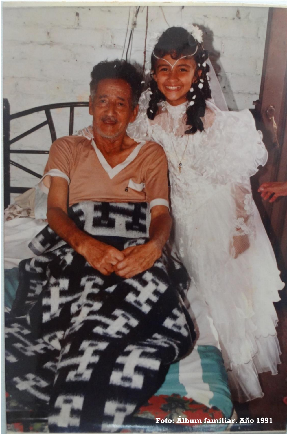
Año 1991

... mi abuelo, poco antes de morir... Hay amores... ¡Ay, amores!