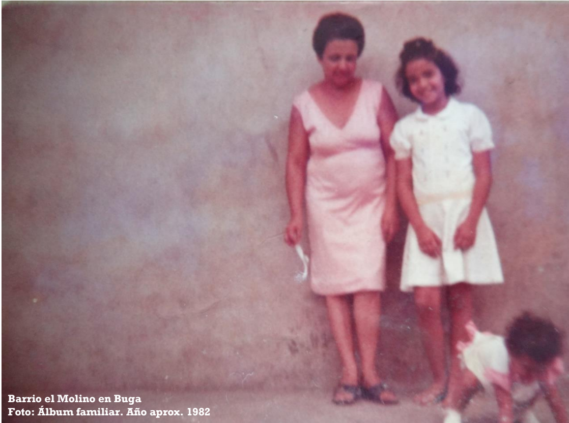
Barrio el Molino en Buga Año aprox. 1982

... jugando con el suelo, inocente del destierro... en una selva de cemento junto a mi hermana y mi madre.