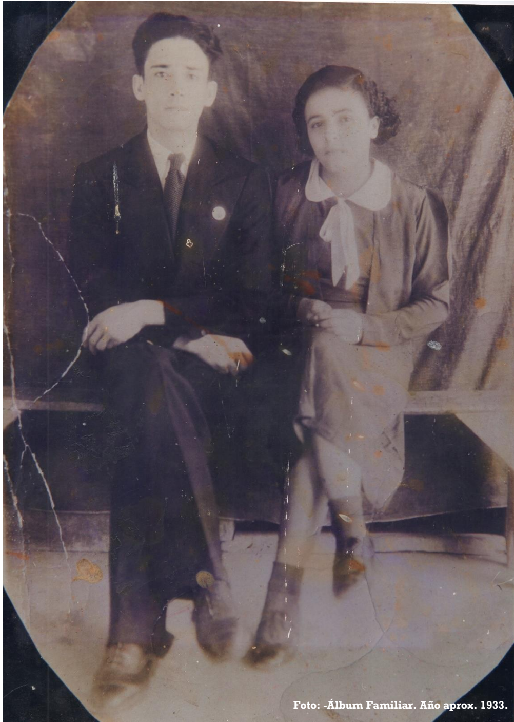
Año aprox. 1933.

Mis abuelos...y pudo más el calor del amor que la tinta del color político...