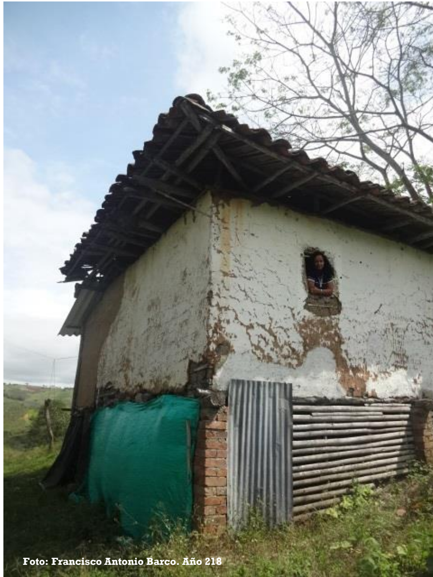
Año 218

“...Nunca nadie antes había hecho sonreír a Caronte, nunca nadie antes lo había hecho llorar”