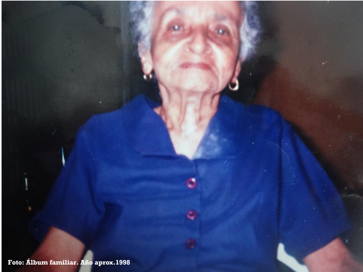
Año aprox. 1998

...mi abuela y su mirada poderosa, segura de sí misma, amante del patio-universo de su casa...