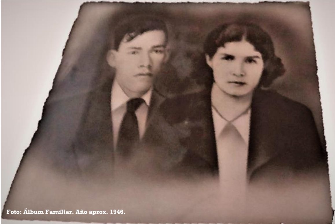
Año aprox. 1946.