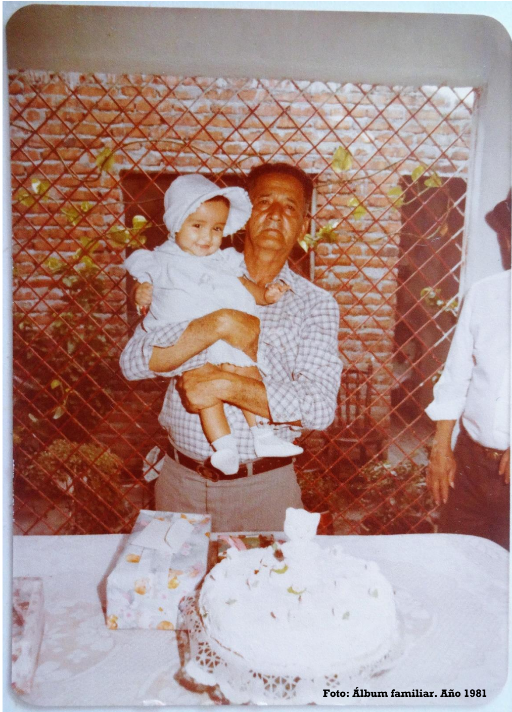
Año 1981

...mi abuelo y Yo, contraste de miradas... agotamiento versus aferramiento a la vida.