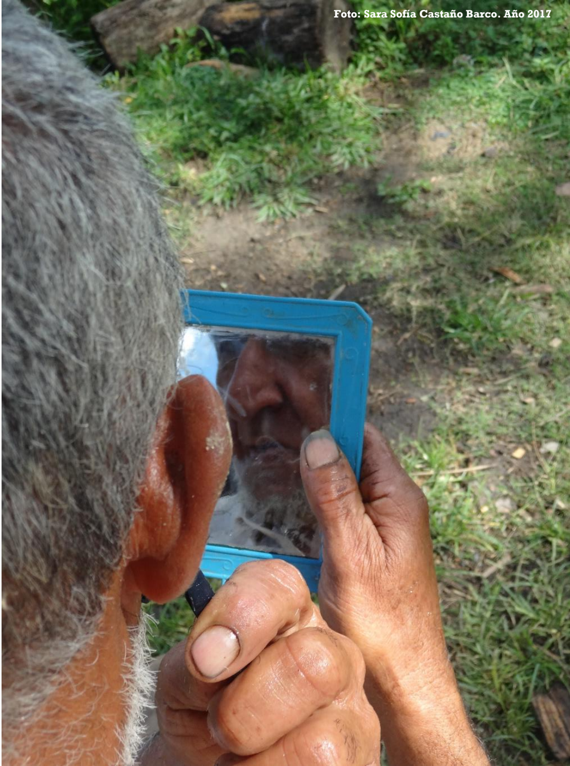
Año 2017

...detenido en el tiempo rural, ¿Qué verá mi tío en su espejo?...