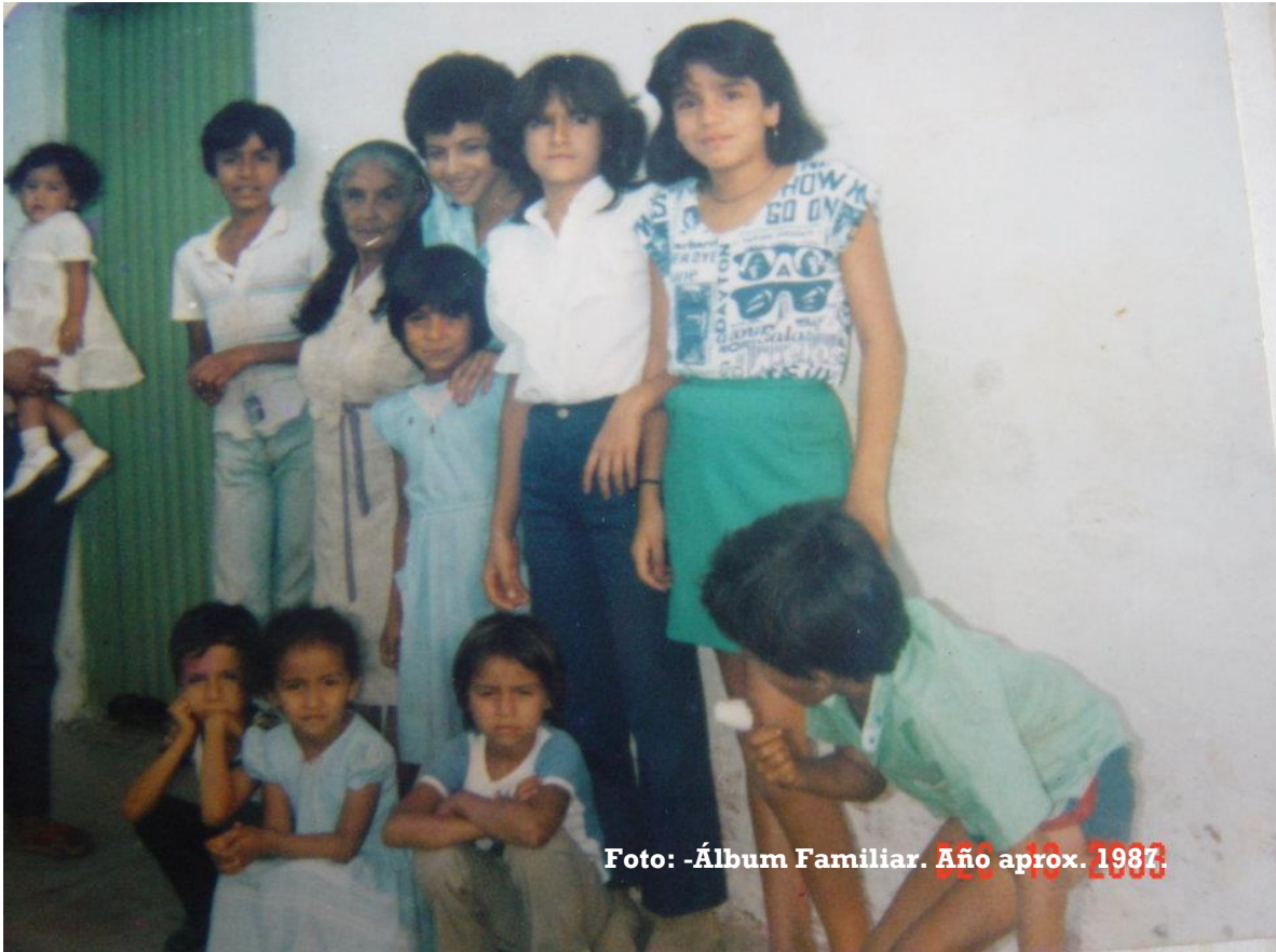
...sentada en el medio, con la mirada profunda y ya intranquila, en El Tambor con mis primos y familiares.