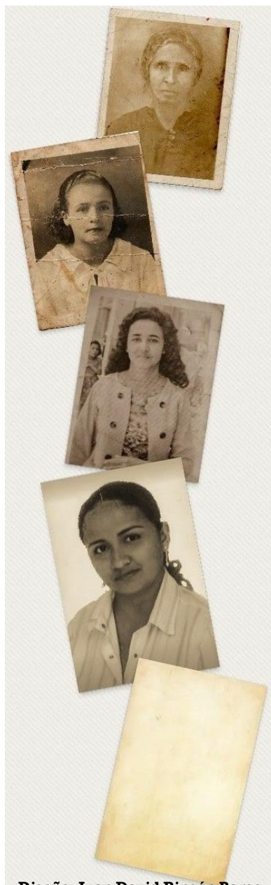
Diseño: Juan David Rincón Barco