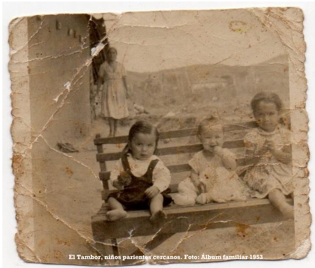
El Tambor, niños parientes cercanos. 1953