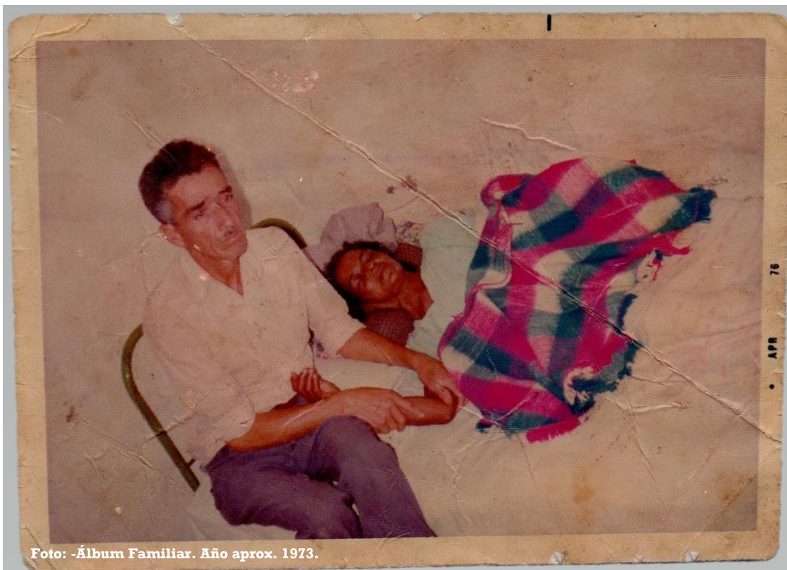
Año aprox. 1973.