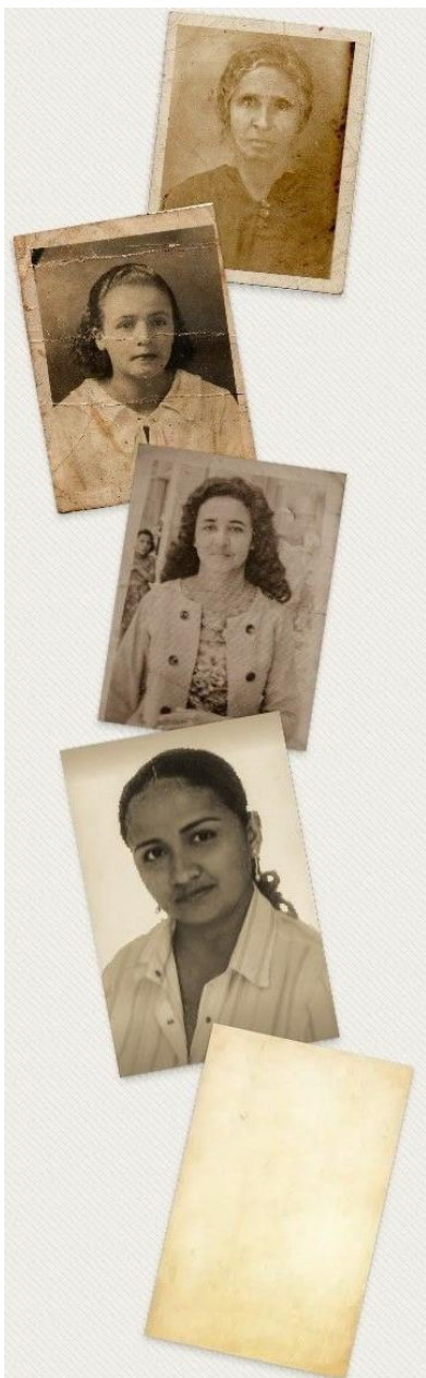
Diseño: Juan David Rincón Barco