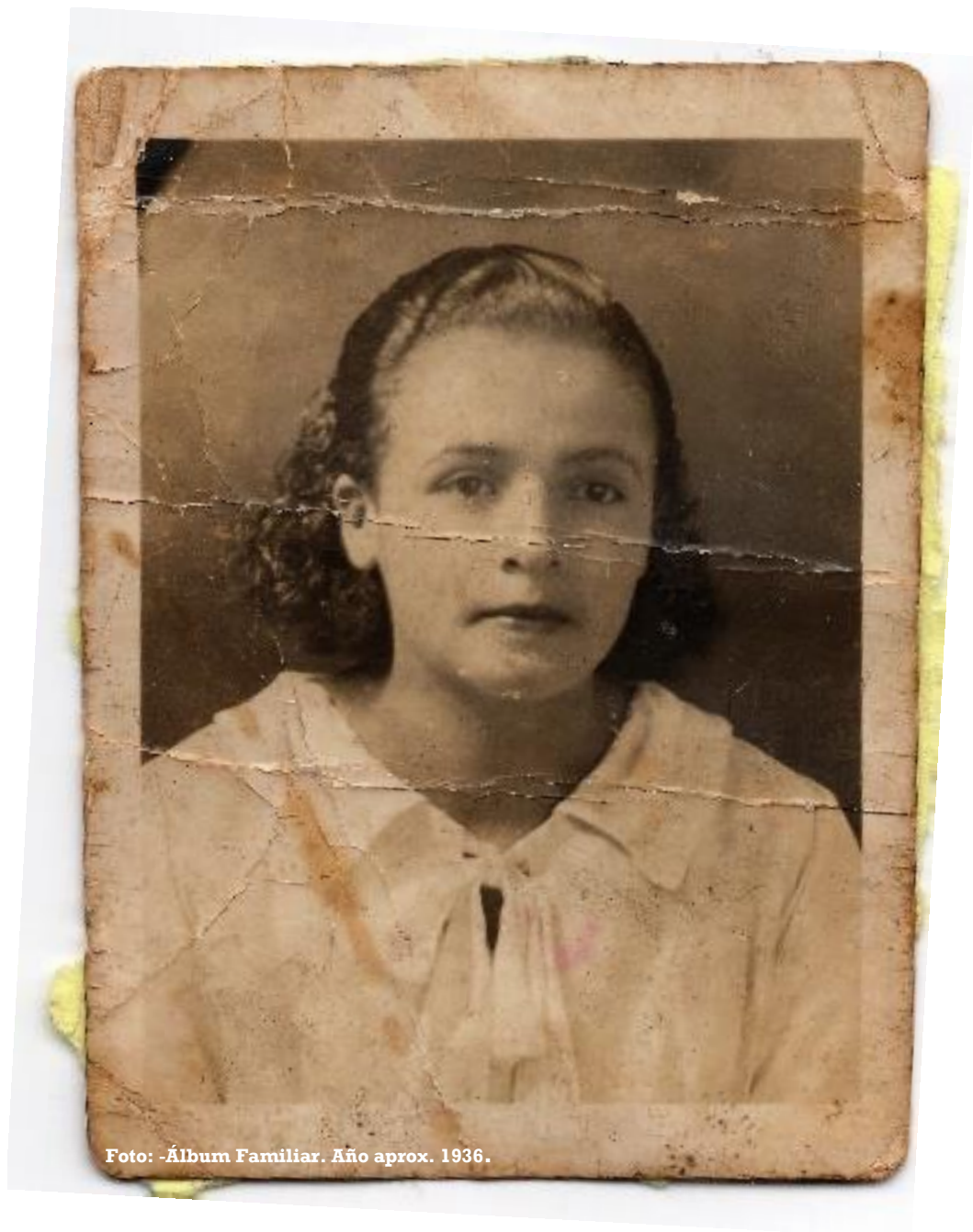
Año aprox. 1936.