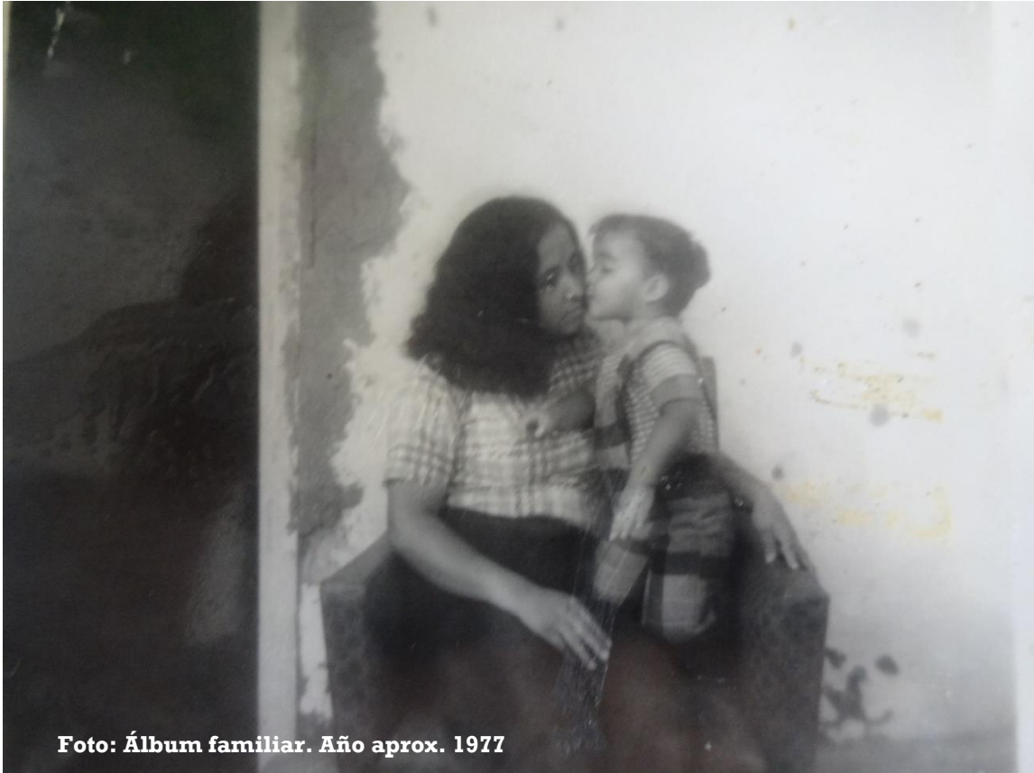
Año aprox. 1977

... mi madre recibe los mimos de mi hermana, como telón de fondo paredes de barro. "...porque esta casita era machetera ¿se acuerda?"