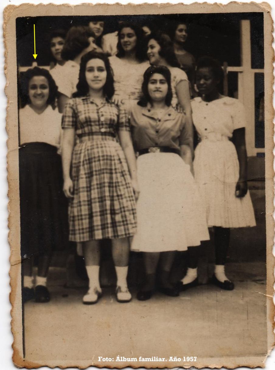
Año 1957