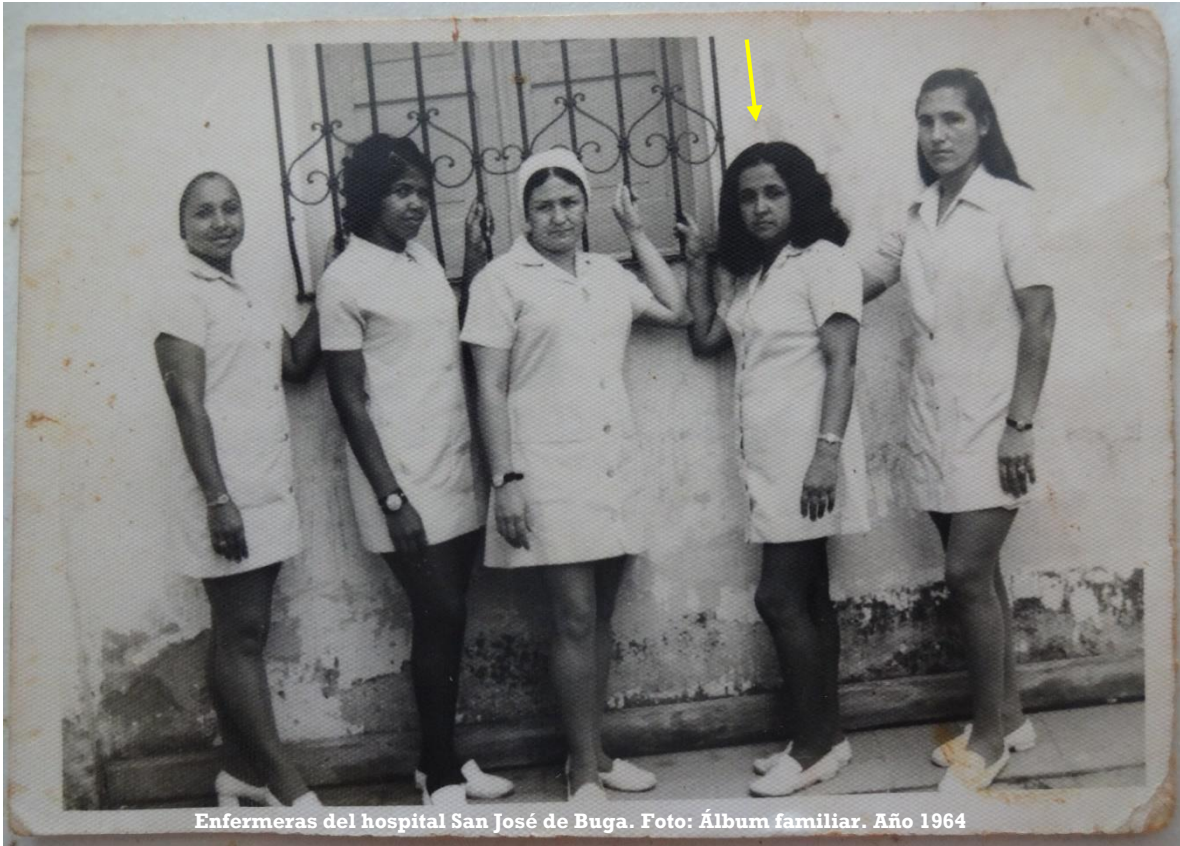
Enfermeras del hospital San José de Buga. Año 1964