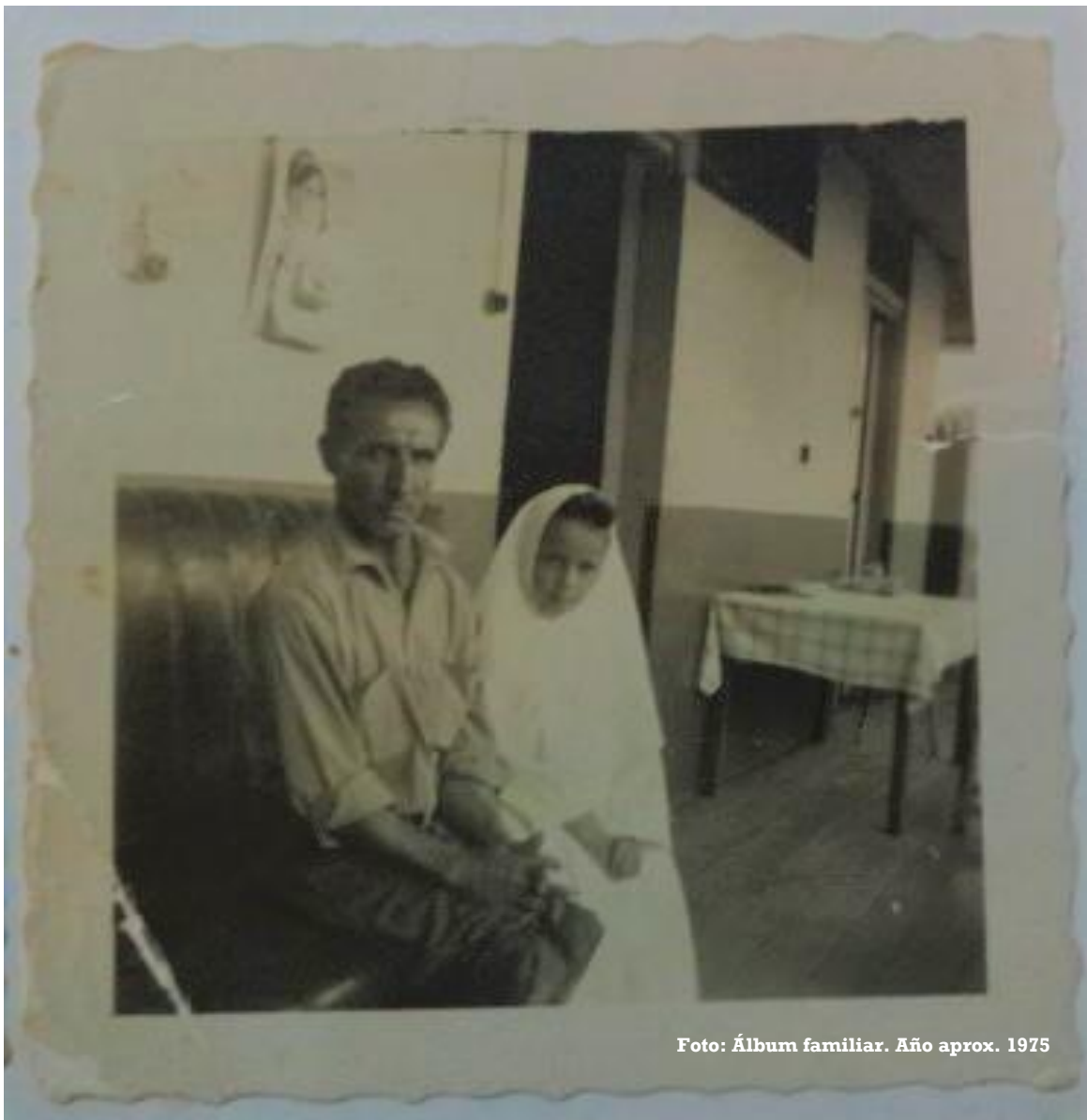
Año aprox. 1975