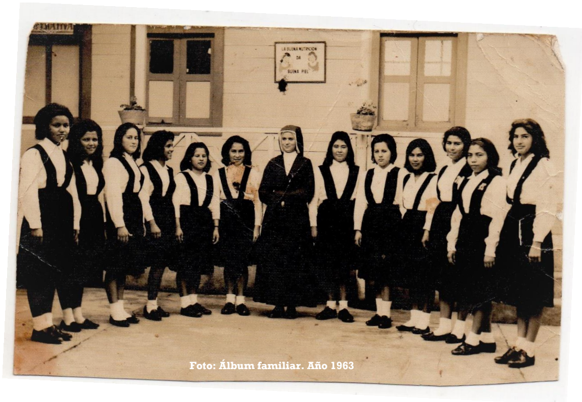
Año 1963

...ser buenas esposas, cocinar, tejer, coser y practicar las “buenas costumbres religiosas”, currículo de formación para niñas y jóvenes en la Escuela Hogar de La Cumbre – Valle.