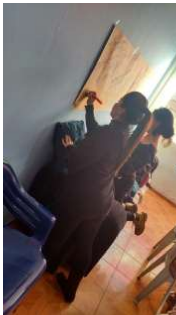
(Taller Escuela Popular de Derechos de las Mujeres Trans, Agosto, 2017)

Dentro del ejercicio de Reconstrucción Colectiva de la Historia –RCH- realizado con la Red Comunitaria Trans, se vio el interés por aprender de la misma experiencia, valorándola como fuente de aprendizaje y aporte personal. En donde no sólo se revisó, observó y recopiló información y vivencias de la organización, sino que también se compartió con las integrantes y se contó parte de la historia que circunda su recorrido y proceso de transformación, que en la mayor parte de los casos era pertinente registrar.