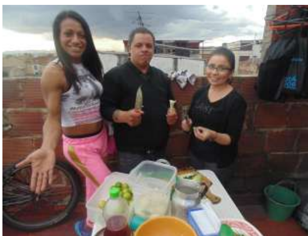
(Transcocho inauguración nueva sede RCT, Marzo, 2017)

En este sentido se realizaron encuentros con la representante legal, en donde se precisaron las rutas de acción, pues la organización planteó la necesidad de recopilar su historia y experiencias que han tenido durante su vida como colectivo, debido a que su historia merece ser contada, siendo posible documentarla; también, se logró apoyar en la organización legal de la Red. Materializando esta primera fase, se adquirieron compromisos entre las dos partes, se realizaron dinámicas de integración en donde se descubriera una mirada introspectiva sobre la misión de cada una de las integrantes de la red a partir de sus concepciones sobre liderazgo y participación. De igual manera, se recopiló la evidencia existente alrededor de su historia.