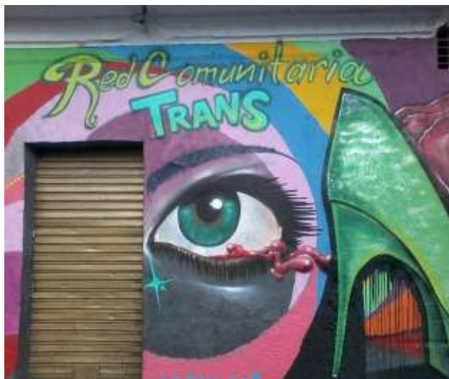
(Imagen de la Sede Red Comunitaria Trans del Barrio Santa Fe, Archivo Andrea Correa, 2015)

En consecuencia al interés de consolidarse como organización no gubernamental, La Red Comunitaria Trans ha desarrollado varias experiencias que han permitido su reconocimiento como actores sociales frente a las autoridades competentes y en gran medida han respondido ante necesidades sociales enmarcadas en los derechos humanos, la participación y la acción colectiva en la lucha por la garantía de los derechos para la comunidad TLGBI. Esto, se puede interpretar a partir de la perspectiva de Melucci (Citado por Giménez, 2003) respecto de la identidad colectiva , la que implica, en primer término, una definición común y compartida de las orientaciones de la acción del grupo en cuestión, es decir, los fines, los medios y el campo de la acción. Por eso, lo primero que hace cualquier partido político al presentarse en la escena pública es definir su proyecto propio – expresado en una ideología, en una doctrina o en un programa.