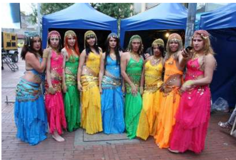
(Integrantes escuela de danzas red comunitaria trans- Archivo personal Andrea Coqueta, 2015)

Con esta academia quieren las mujeres Trans compartir su saber y destreza a otras comunidades y generar espacios de esparcimiento y aprendizaje y de esa forma arrebatarle a la calle un ser más, es decir una persona menos en prostitución, drogadicción, microtráfico, entre otros, exposiciones en las que se encuentran por obligación, opción o desconocimiento. Además de crear cultura y arte en cada una de las integrantes, que consideren que sus cuerpos pueden ser su mayor potencial positivamente hablando, ya que la danza libera, relaja, expresa y ayuda a la salud física y mental. El baile es cultura, educación, expresión y por ende practicarlo es de gran beneficio para el ser y el hacer.