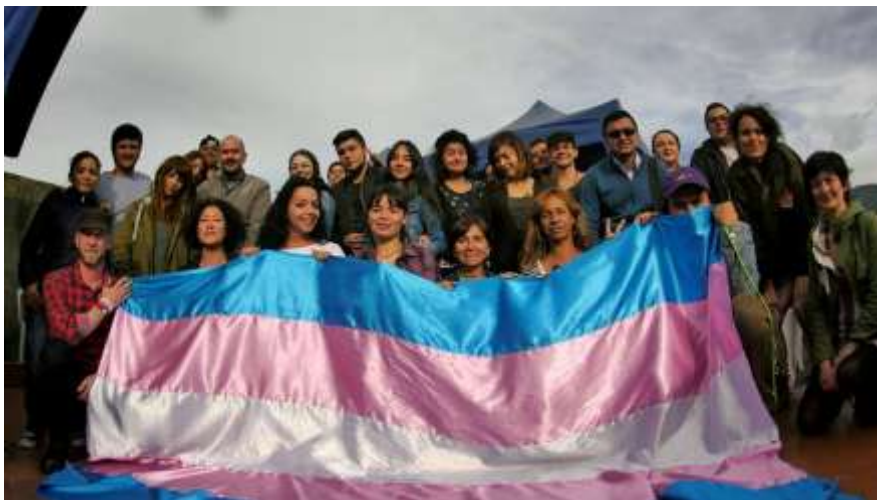
(Acompañamiento jornada Visita de la comisión de género de las Farc-EP a la sede de la Red Comunitaria Trans , intercambios de diálogos y experiencias de vida, Marzo, 2017)

Incluso su trabajo social les ha permitido empoderarse como colectivo, afianzar vínculos entre pares, ser conocidas por entes Internacionales, donde han podido desarrollar proyectos de atención en salud, talleres prácticos educativos, actividades lúdicas y de crecimiento académico en la Ciudad, además del baile y el deporte.