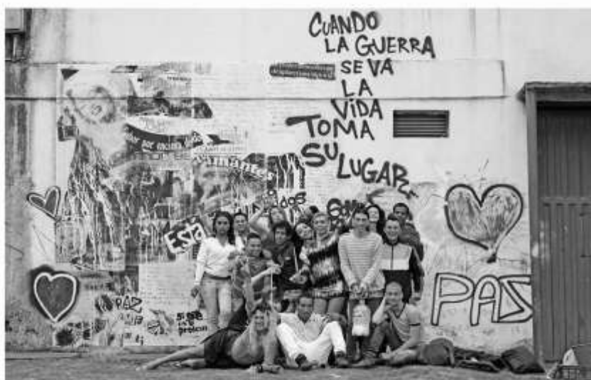
Mural de Construcción de Paz con la población LGBTI. Proyecto Cuerpos en Prisión, Mentes en Acción. Carcel la Picota abril del 2017.

La historia de las personas trans recluidas en el país empezó a escribirse con contundencia jurídica en 2011. Sólo hasta ese año la Corte Constitucional profirió una sentencia que le ordenó al Instituto Nacional Penitenciario y Carcelario (Inpec) realizar una campaña de sensibilización y capacitación con los funcionarios, guardias e internos, sobre la protección de los derechos de los reclusos y reclusas de identidad sexual diversa. (Herrera, 2015).