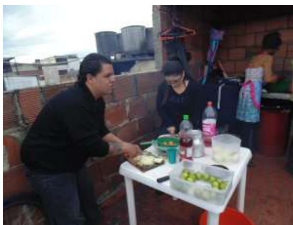
(Transcocho inauguración nueva sede RCT- Archivo personal, Marzo, 2017)

La segunda fase que se denominó: “ reconstrucción de los procesos o experiencias objeto de estudio ”, se precisaron las temáticas sobre las que se organizó la reconstrucción de la experiencia y con base en esto se implementaron diversas estrategias como la revisión documental, entrevistas, grupos de discusión, encuentros pedagógicos, temáticos, sociales, etc. Durante dichos encuentros y para efectos de la investigación, se decidió entrevistar a las lideresas de la Red Comunitaria Trans, que han estado desde la creación de la organización y que han sido parte clave en cada proceso de la misma, con el fin de hacer memoria, de reconstruir su historia.