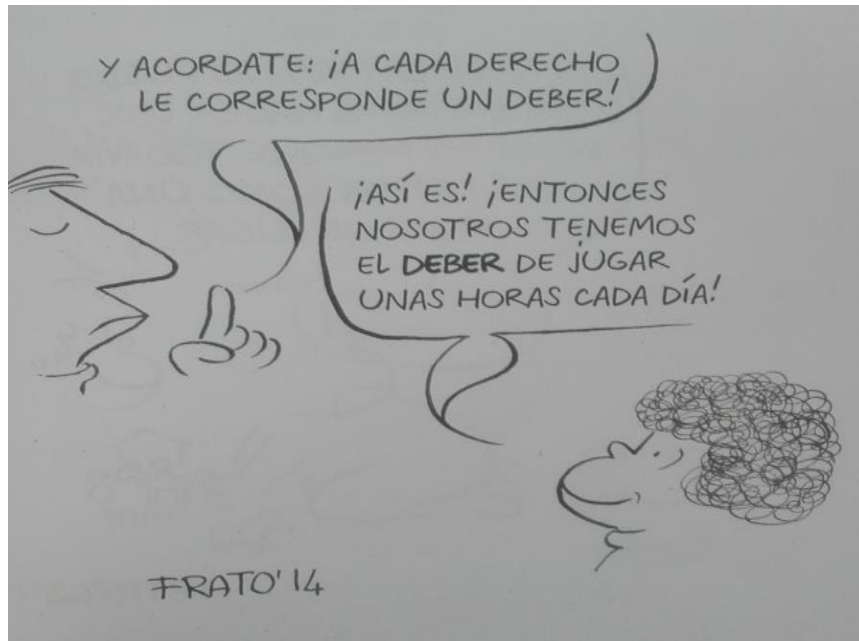
Gráfica 1 4

Derechos y deberes tienen relación directa en su construcción y en la práctica debería reflejarse. La coherencia entre estos es un elemento que se pone en tensión en los manuales de convivencia de las instituciones educativas y en la formación que desde allí se dirige. La imagen refleja la participación que los niños, niñas y adolescentes 5 piden para la determinación de estos derechos y deberes y que demuestran la forma de entenderlos