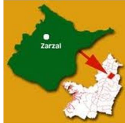
Figura 2. País Colombia, Departamento Valle del Cauca, Municipio Zarzal.

El poblado se caracteriza por su gran empuje comercial, ya que existen en el municipio gran cantidad de almacenes de ventas de productos de primera necesidad; tiene una plaza de mercado, la cual sirve de referencia para varios municipios de sus alrededores.