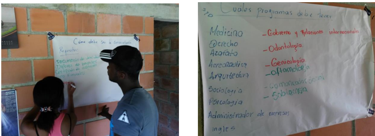
Figura 3. Propuesta de los jóvenes de cómo debe ser la convocatoria y que programas debe contener.

Estos jóvenes tienen sueños y entre sus sueños esta ingresar a una universidad de educación superior sin mayor dificultad, queriendo ingresar a carreras que anhelan, pero que no existen en sus contextos.