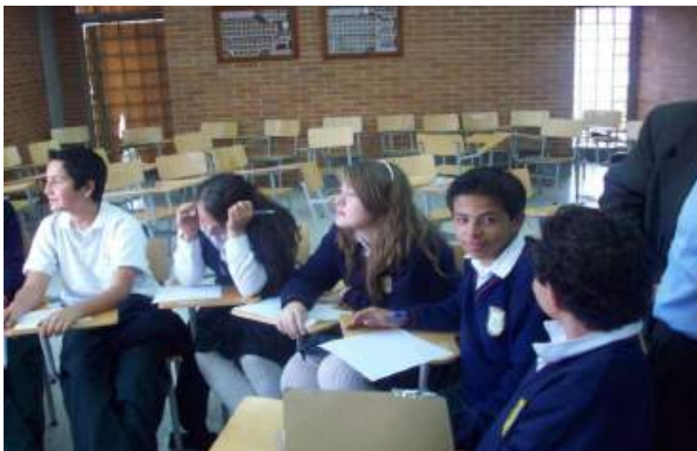
Fotografía No. 2 Grupo focal (Aula múltiple)

La intención desde este instrumento es focalizar la atención, discusión e interés en unos pocos estudiantes que están implicados en el conflicto escolar con el objeto de comprender sus maneras de pensar y sentir mediante la interacción y la contrastación de las opiniones de sus miembros. Por otra parte centra la discusión sobre algunos tópicos o temas específicos, creando un ambiente físico y social que le permite al grupo de manera informal y espontánea exteriorizar sus percepciones, actitudes y opiniones sobre el asunto que se está investigando.