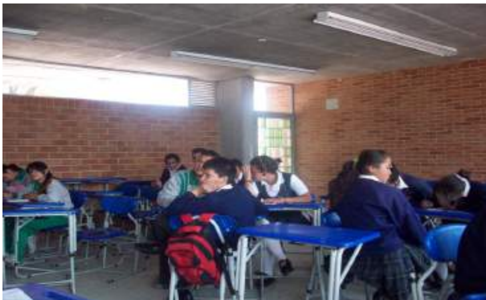
Fotografía No. 4 Espacio escolar (aula)

minucioso de los datos, en este ejercicio se asignaron códigos que sirvieron de base en el análisis y que dan cuenta de los resultados de la investigación. (Ver Anexo 6)