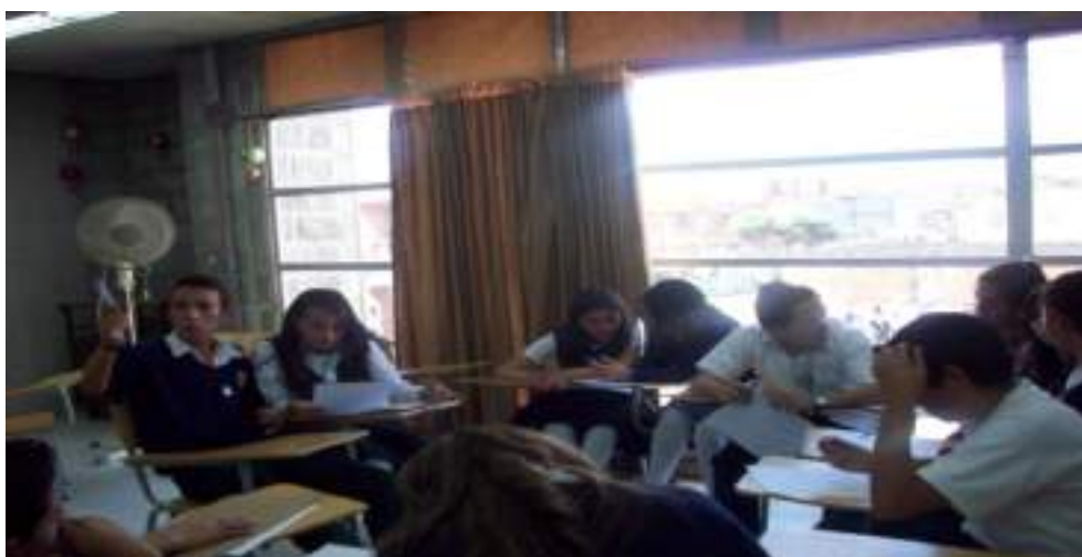
Fotografía No. 7 Procesos de interacción y lenguaje (Aula múltiple)

La interacción y el lenguaje distinguen a los seres humanos de otras especies puesto que estos elementos nos caracterizan como seres sociales capaces de realizar intercambios comunicativos y relacionarnos con nuestros semejantes. En la vida social y en la interacción de la escuela en cada momento, los estudiantes se están comunicando de diferentes formas, emiten mensajes simbólicos en las relaciones que establecen puesto que se reconocen en el otro estableciendo puntos de encuentro