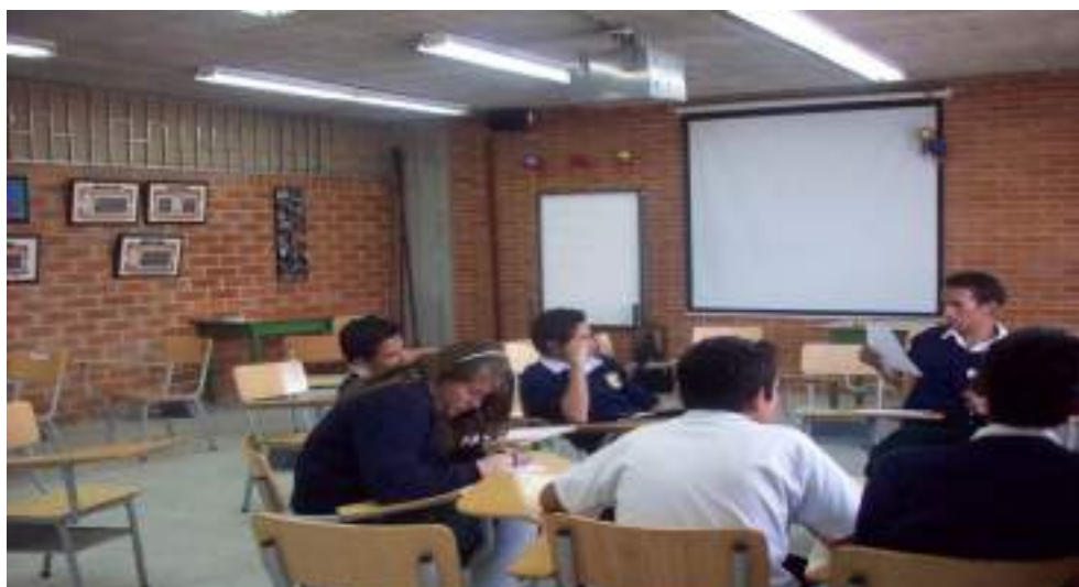
Fotografía No.3 Entrevista (Aula múltiple)

Se ha usado la entrevista como herramienta cualitativa, ya que ésta permite recoger información sobre los temas y situaciones que son pertinentes de acuerdo a la interpretación que otorgaron los entrevistados, recogiendo varios tipos de información con los estudiantes acerca del tema de estudio. Aunque existen diferentes tipos de entrevista que pueden ser utilizadas en la investigación cualitativa: entrevista informal conversacional o no estructurada, entrevista estructurada, entrevista estandarizada y entrevista individual o en profundidad por las características de la investigación se tuvo