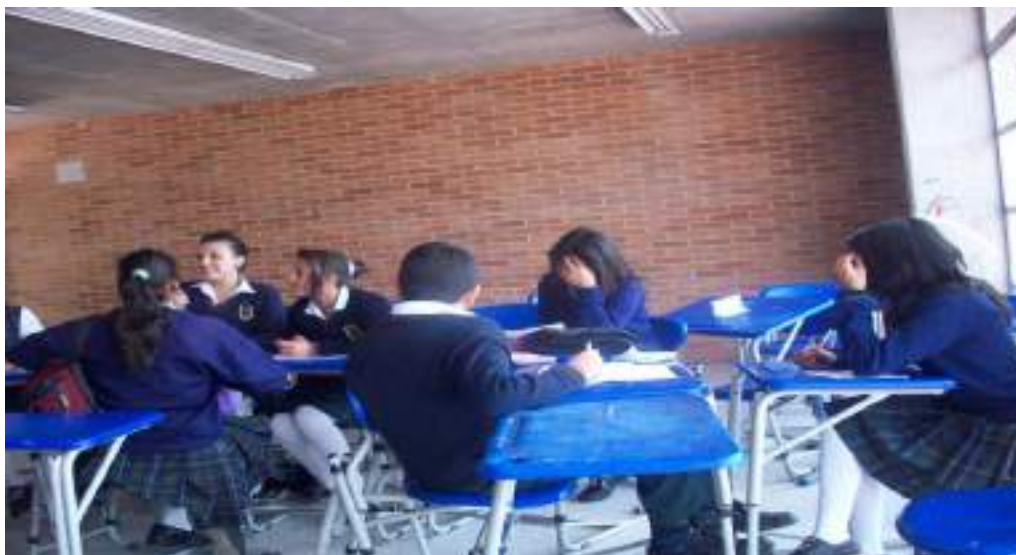
Fotografía No. 6 Dialogo entre estudiantes para resolver el conflicto (Aula)

“Dos niños de un curso menor, uno empujó al otro, causando empujar a mi compañero, el se enojó y lo trató mal, pero a mi lado estaba el hermano mayor del niño que lo empujó...lo que causó que se agarraran a darse golpes” (MOPR).