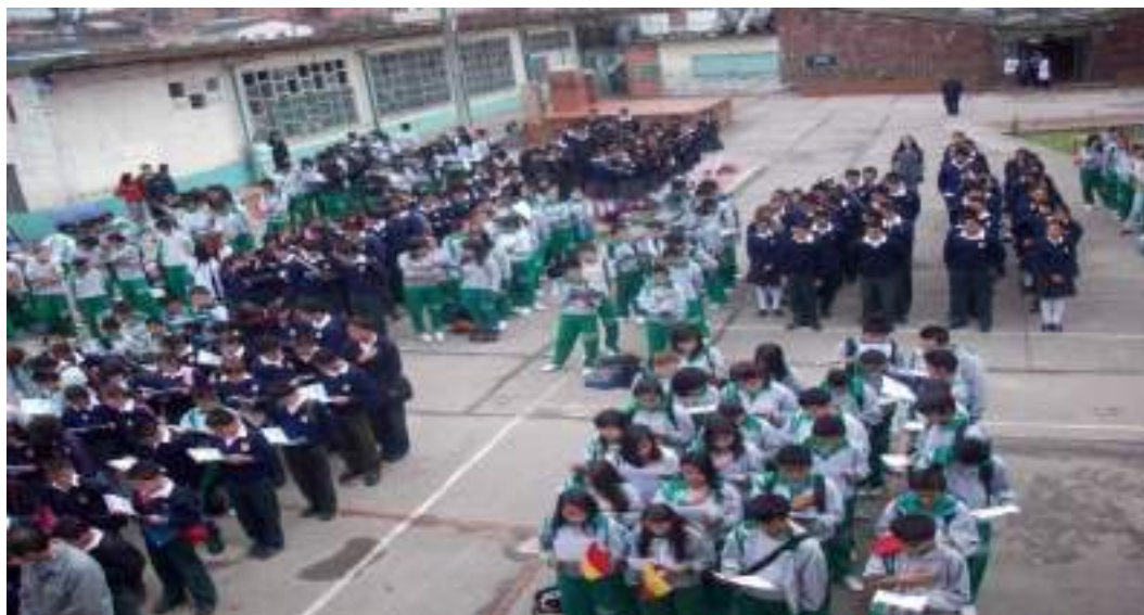
Fotografía No. 1 Formación institucional (Patio principal)

que le permita interactuar socialmente sin tener que recurrir a la pelea constante. Bajo esta concepción se hace necesario y urgente que se propenda por una escuela que valide al otro, al contrario, como un igual desde el reconocimiento de la diferencia, y que la tolerancia y el respeto no sean asuntos de discurso sino de vivencias.