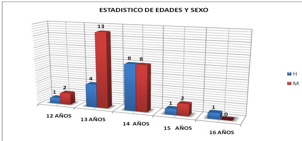
Tabla 2. Estadístico de edades y sexo