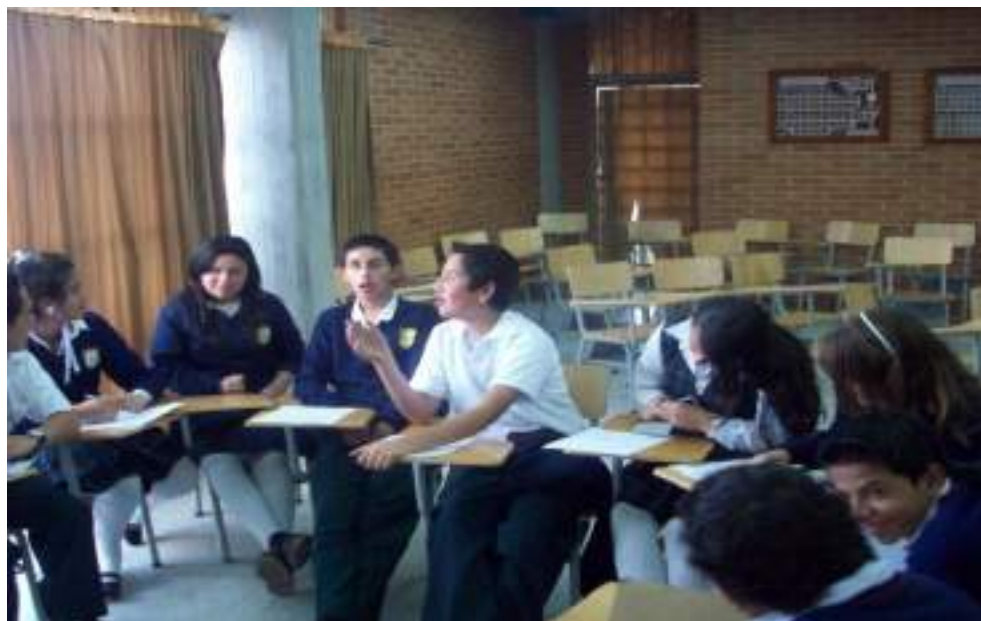
Fotografía No. 5 Acciones gestuales en espacios académicos (Aula múltiple)

actividades como el juego se tornen agresivas. “no me gusta que me peguen cuando estamos jugando” (COMO).