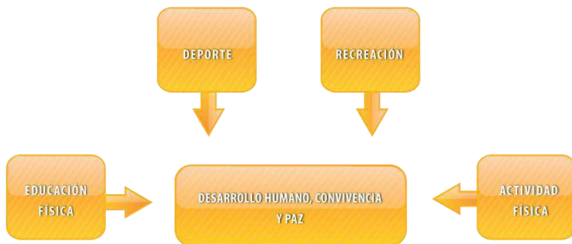
Ilustración 1 Enfoque Conceptual del plan decenal 2009-2019

Para los propósitos del Plan Decenal, se reconoció la importancia e interdependencia del deporte, la recreación, la educación física y la actividad física como bienes socialmente necesarios subordinados a la política social y de manera especial al desarrollo humano, la convivencia y la paz. (COLDEPORTES I. C., 2009)