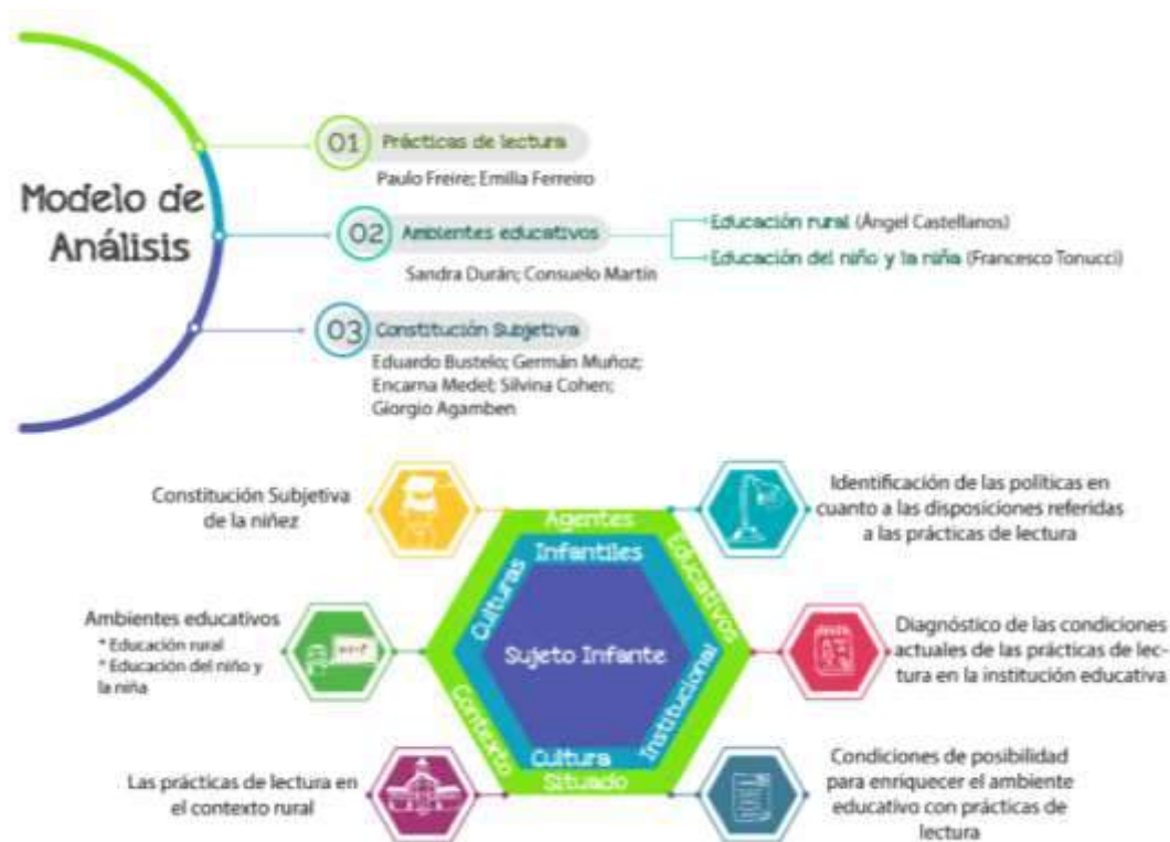
Figura 1. Diagrama del modelo de análisis.

De acuerdo con el problema formulado y el propósito del estudio, a continuación, se presenta el modelo de análisis (figura 1), que da cuenta de las primeras decisiones epistemológicas que guiaron la investigación, de la perspectiva teórica. Por consiguiente, se trabajan tres grandes categorías. Estas categorías son, constitución subjetiva, ambientes educativos y prácticas de lectura, con las subcategorías de educación rural y educación del niño y la niña.