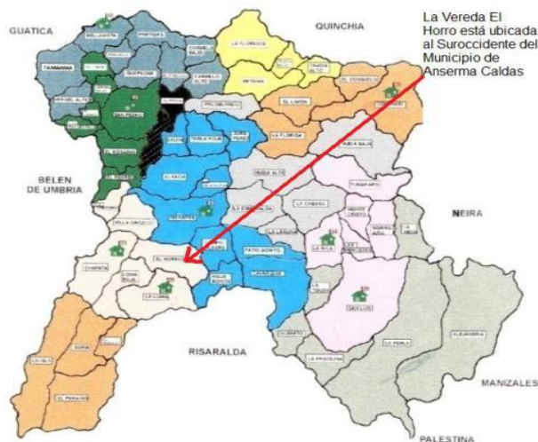
Figura 1: Mapa de Anserma, Municipio de Caldas, Colombia