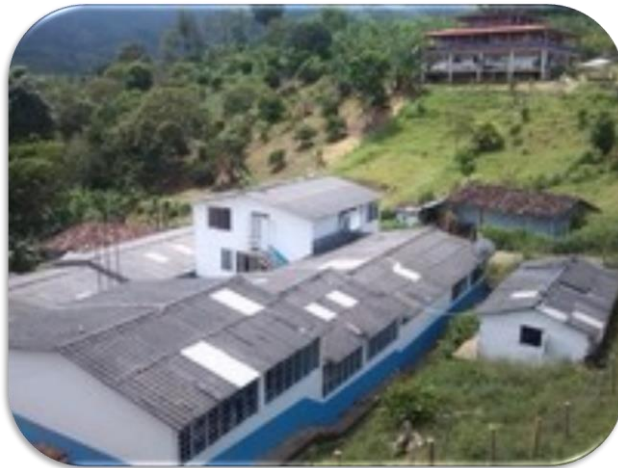
Figura 2: Institución Educativa El Horro, Sede Central