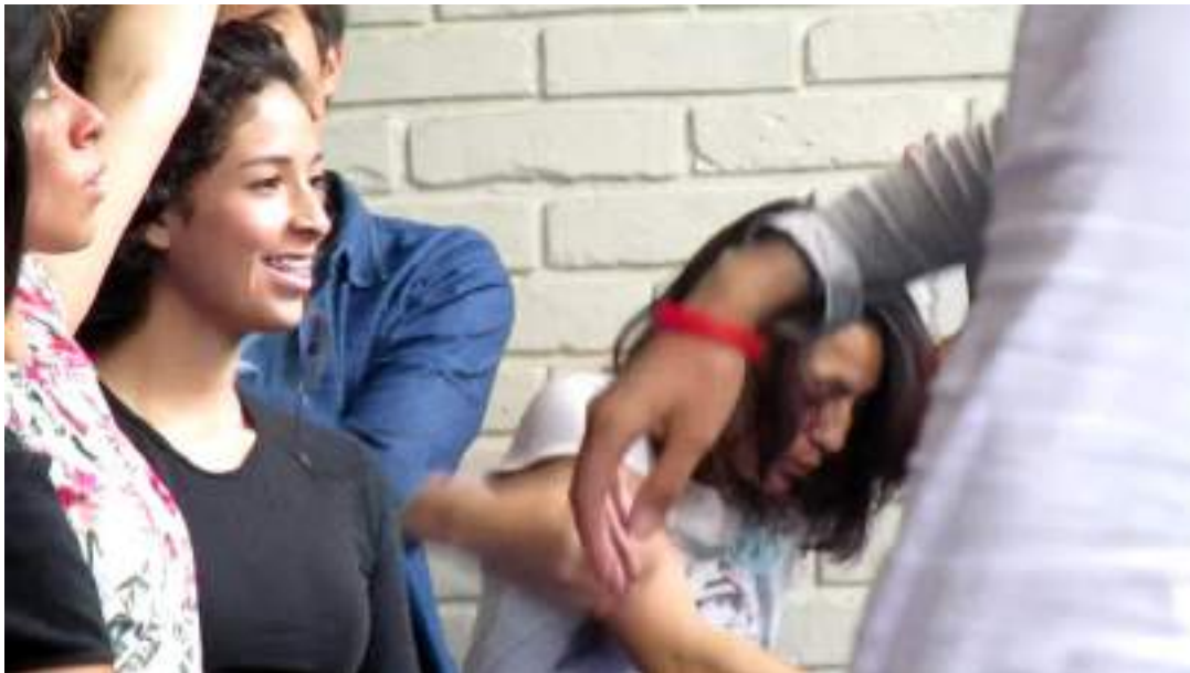
Clase 3 cuerpo Fotograma 0604