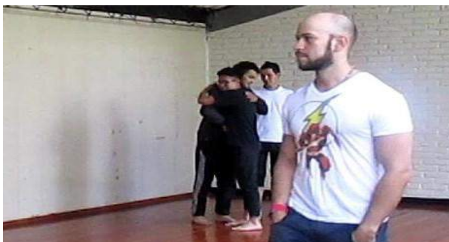
Clase 1 Cuerpo fotograma_0526