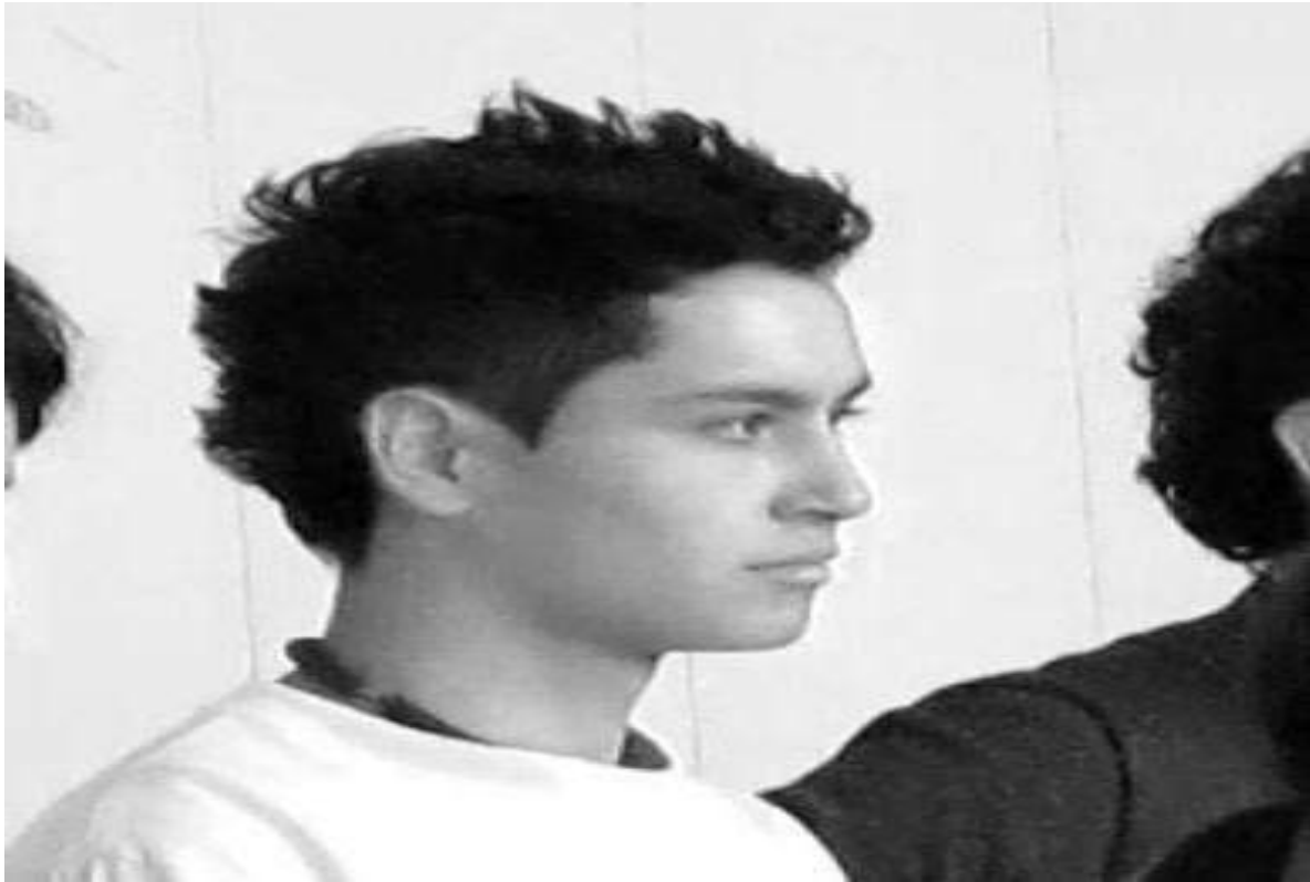
Clase 3 Cuerpo Fotograma_438