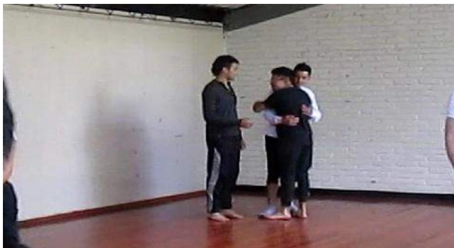
Clase 1 Cuerpo fotograma_0524