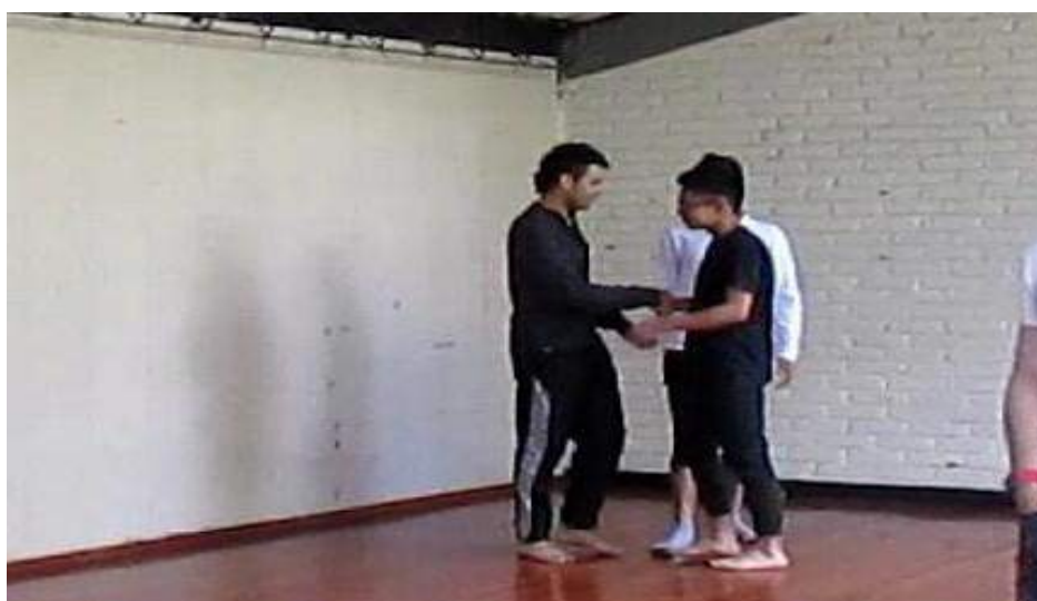
Clase 1 Cuerpo fotograma_0525