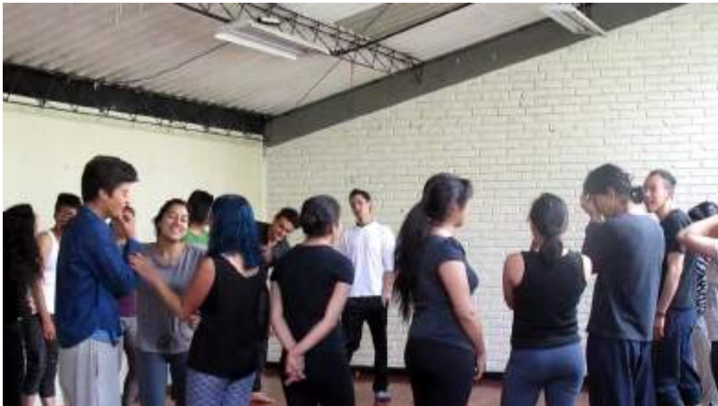
Clase Cuerpo Fotograma 0277

“[...] soy una mujer bastante, alegre, me gusta bromear mucho,... (Ríe) soy muy sensible, demasiado sensible, [...]” (8S:781).