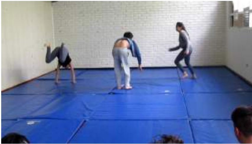
Clase 2 cuerpo Fotograma 0062