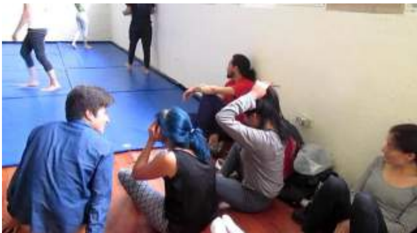
Clase 2 cuerpo Fotograma_0160