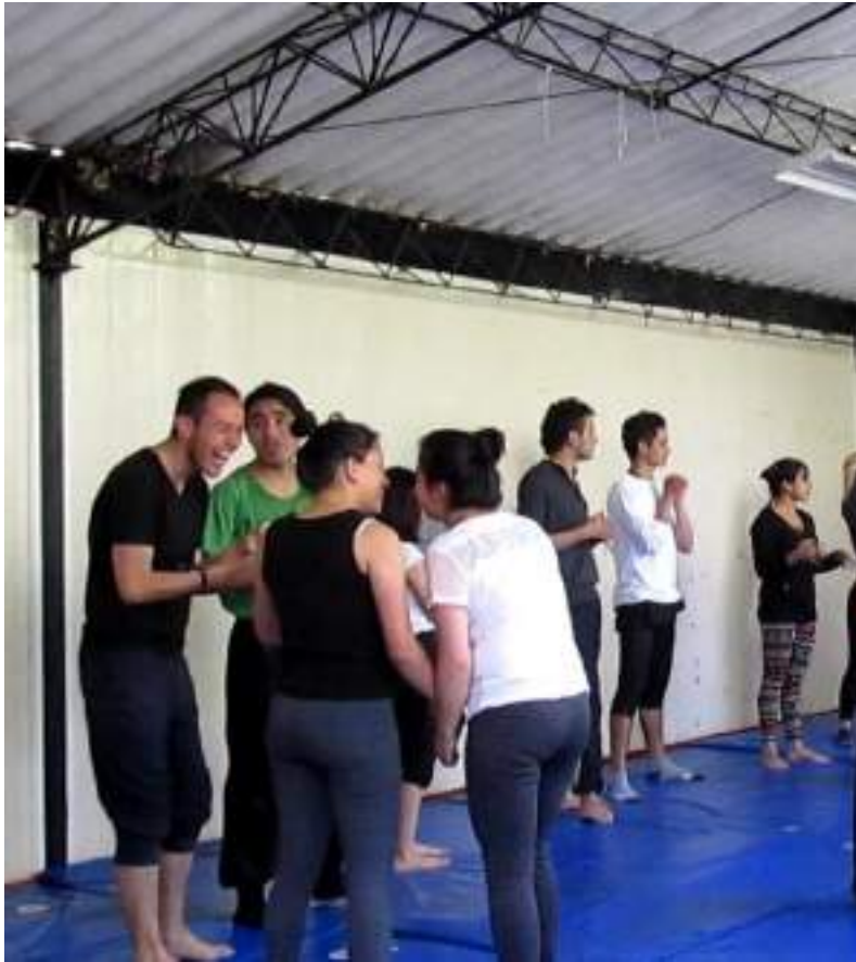
Cuerpo 1 Fotograma 1202