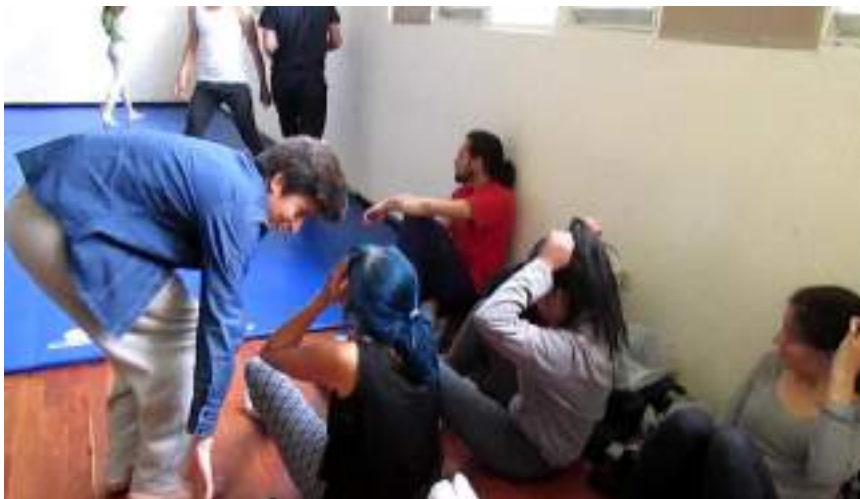
Clase 2 cuerpo Fotograma_0159