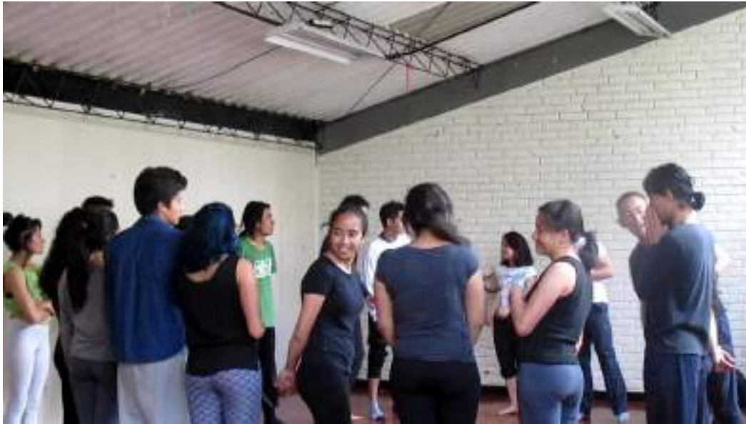
Clase Cuerpo Fotograma 0252