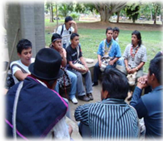
Fotografía 8. La Tulpa del lago .

contrarrestar la carencia de espacios de encuentro al interior de la Universidad, lo que quiere decir que La Tulpa del lago (por su cercanía al lago de la universidad) nace con el propósito de ser el punto de convergencia de iniciativas académicas, deportivas y artísticas que permitan, entre otras cosas, mostrar el trabajo de los diversos grupos estudiantiles de las comunidades indígenas del país.