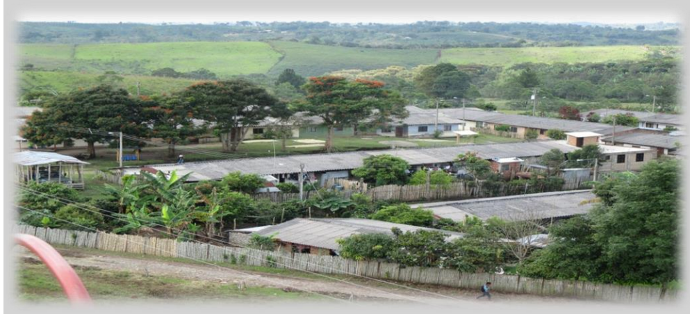
Fotografía 61. Cabecera del resguardo Muse Ukwe-vereda Santa Rosa.

Las recuperaciones anímicas, psicológicas y culturales fueron las más lentas, puesto que la salida forzada del territorio —y la llegada a uno desconocido—, implicó enfrentar nuevos retos, muchos de ellos inéditos. Con decir que en varios sitios no querían la presencia de grupos indígenas. Afortunadamente los morelenses los aceptaron; no obstante la curiosidad que despertaron porque los morelenses contemplaban la posibilidad de conocer gente con “taparrabos”, como en los textos o en las viejas películas.