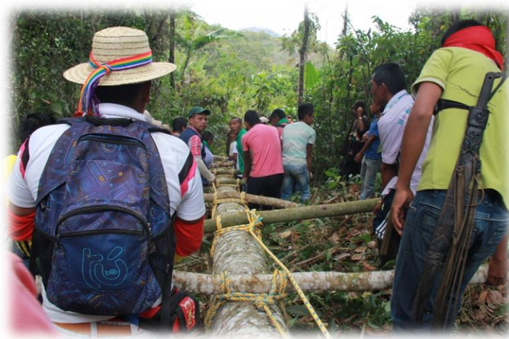
Fotografía 25. Tumbada de árbol.