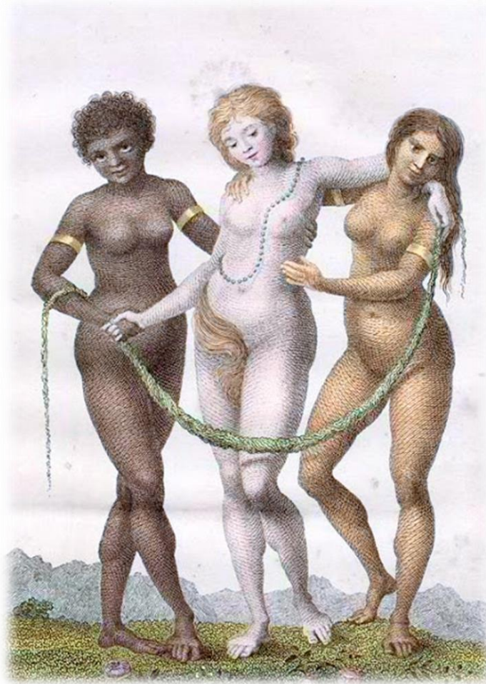
Pintura 2. Europa sostenida por África y América (William Blake). "El puente étnico" 6

El ser humano es -también- un ser geográfico con todo lo que ello implica, Blake grava lo que aquí nombramos Cuerpos Geográficos, paisaje de los símbolos, de las significaciones, de las percepciones, de las representaciones y de las emociones del Descubrimiento de América. Cuerpos Geográficos del Descubrimiento de América que representan valores heterogéneos provistos de direcciones de gran significación, fueron los imaginarios sociales del acto fundacional de la Conquista, de la superioridad de unos hombres sobre otros y con ello de la superioridad de unas formas de conocimiento sobre