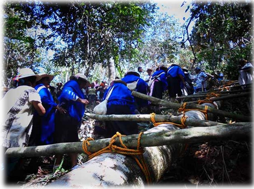
Fotografía 29. Cargada del árbol Corinto 2015.