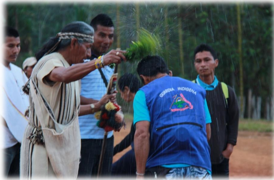
Fotografía 26. Llegada de participantes y refrescamiento 1.

el corte, por tratarse de un árbol hembra. En algunas zonas del Cauca, como el Saakhelu de Tierradentro no se permite la presencia de ninguna mujer, mientras que en el de la zona norte, debe estar presente una, para que le de fuerza a la armonización, en el momento que los médicos hacen los pagos. Es importante que todos los hombres, desde los niños hasta los ancianos, le den machetazos al tronco porque simboliza unidad y vitalidad, de lo contrario, denota pereza y es ésta, uno de los peores enemigos en la vida del campo, este es un buen modo de erradicarla. De igual manera, una vez se corta el tronco, todos deben participar cargándolo para que haya unión de fuerzas y poder transportarlo; el Thë' Wala no ayuda a cargar el tronco porque va adelante, atrayéndolo con los remedios, para que no se llene de malas energías y no sea tan difícil su movilización”. En el sitio destinado para el ritual, están esperando las mujeres y demás comuneros que no hayan acompañado el corte del tronco, todos deben estar previamente bañados en la cabeza por los Thë' Wala , con remedios frescos, llamados también remedios de armonización, que son la mezcla de plantas de clima caliente, templado y de páramo. Los médicos lo hacen para eliminar las malas energías y dejar sólo energías positivas; los que van llegando también deben ser bañados”. (Pamino, 2008: 153)