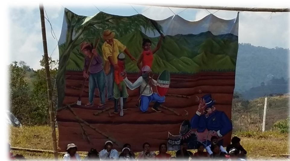
Fotografía 58. Fotografía de la guardia indígena de Corinto, agosto de 2015. Pintura representando la familia indígena defendiendo la tierra del monocultivo de la caña de azúcar.