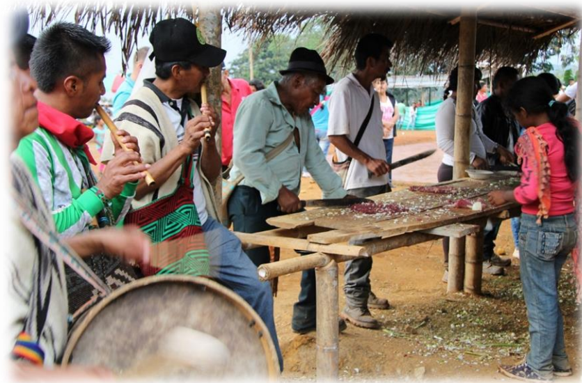
Fotografía 43. Picada de la carne 1 .