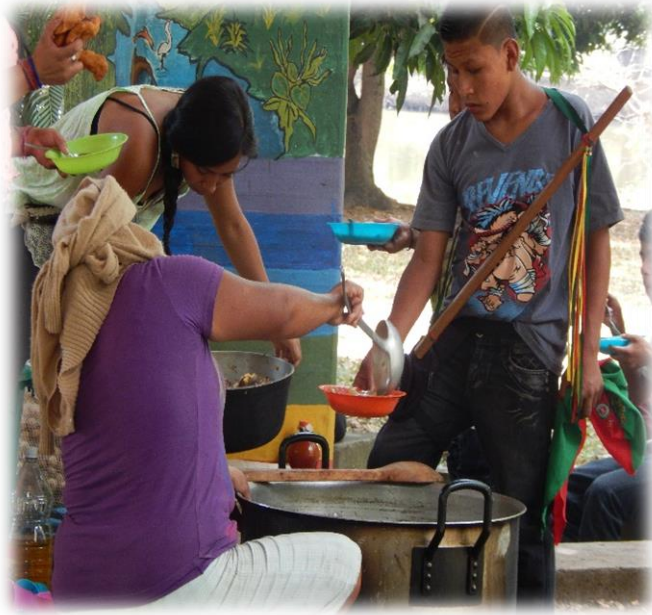
Fotografía 16. Almuerzo comunitario