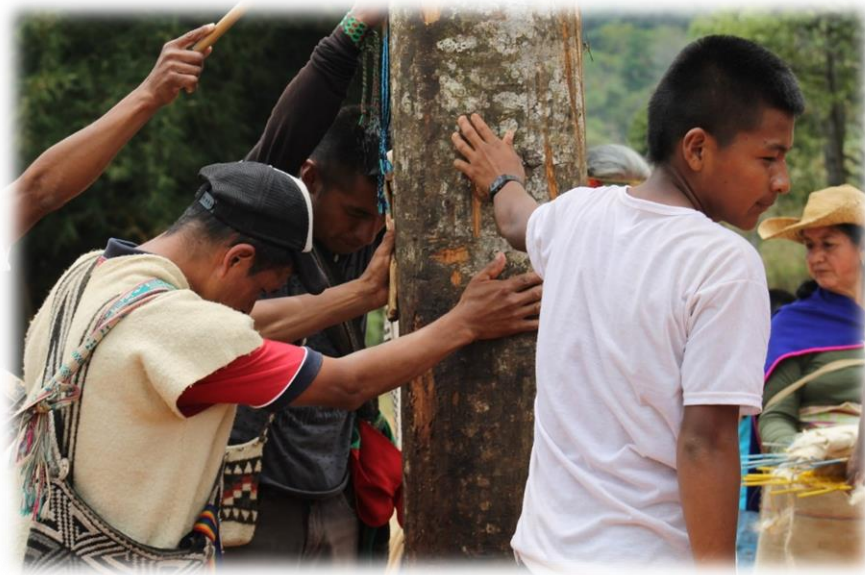
Fotografía 54. Unidos al SAAKHELU 2.

compartido entre los miembros de la comunidad; son Cuerpos Geográficos-Sur gestados en las habitancias del Abya Yala.