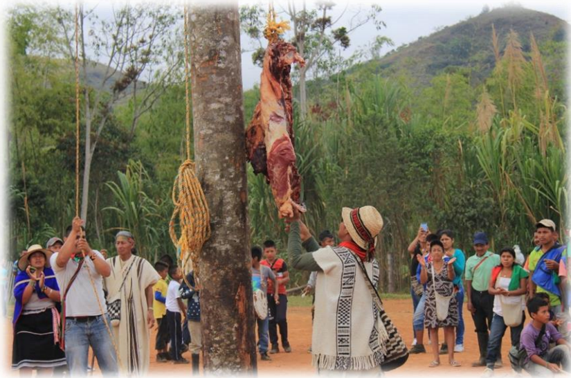
Fotografía 33. Subida de la ofrenda en el poste mayor.