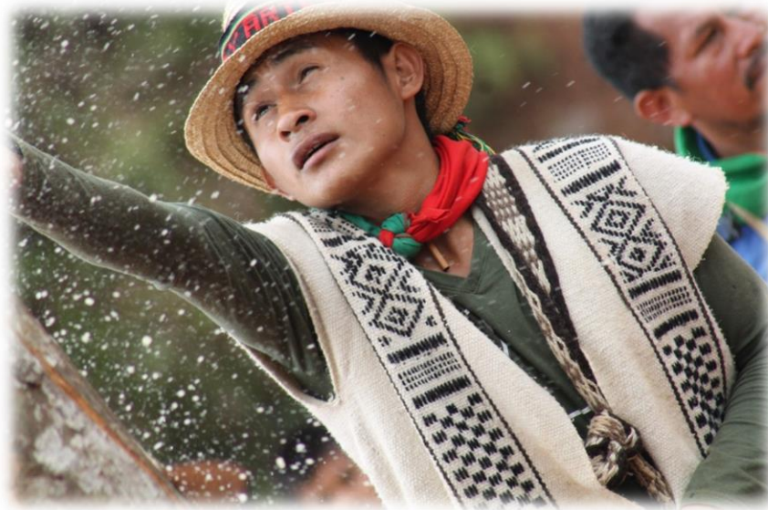
Fotografía 47. La ofrenda al poste mayor 1 (resguardo Huellas 2016).

El segundo día de ritual inicia con los pagamentos al poste mayor. El Thë' Wala , junto con varios mayores, se dirigen hacia el poste mayor. Cada uno de los acompañantes, hombres y mujeres llevan un elemento a ofrendar. Al llegar al poste, uno a uno, va haciendo entrega al Thë' Wala de la ofrenda.