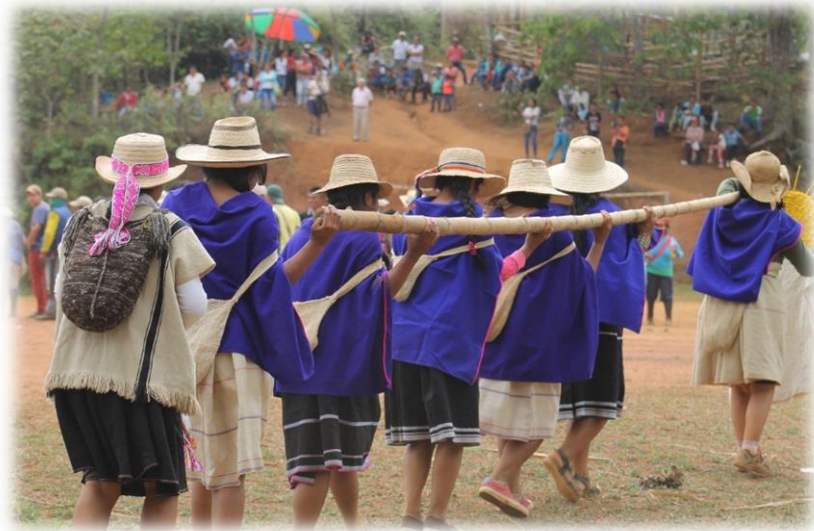
Fotografía 36. Cargada del Saakhellu hembra por las mujeres.