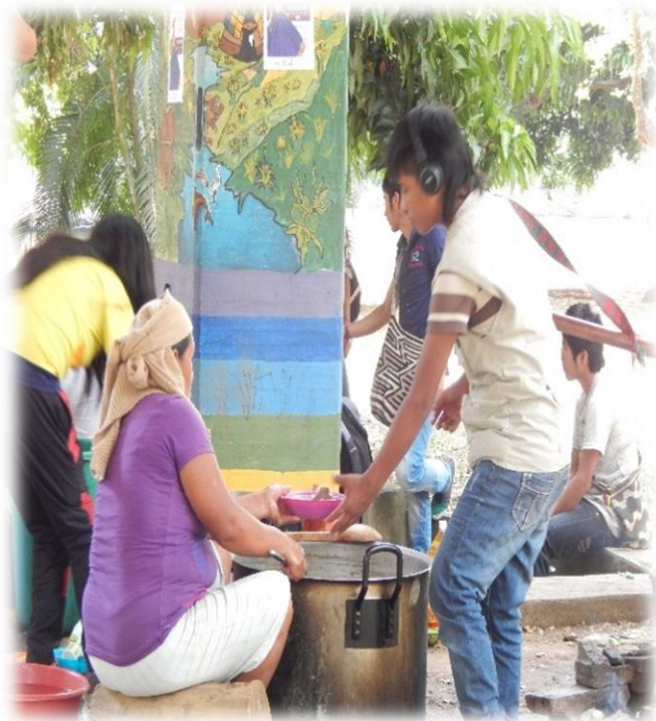
Fotografía 17. Almuerzo comunitario.