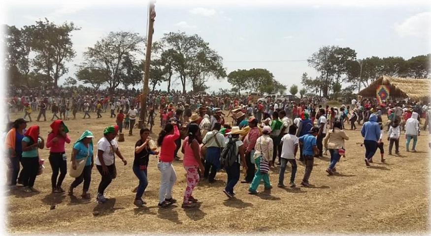
Fotografía 49. Danza del caracol.

El baile incita a la euforia, a estos gritos y mientras los danzantes transitan, los organizadores reparten chicha a diferentes segmentos de la fila, el ambiente es festivo, por todos lados se respira picardía y optimismo.