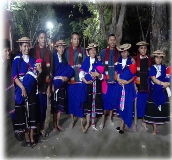
Fotografía 21. Grupos de danza Andinos.