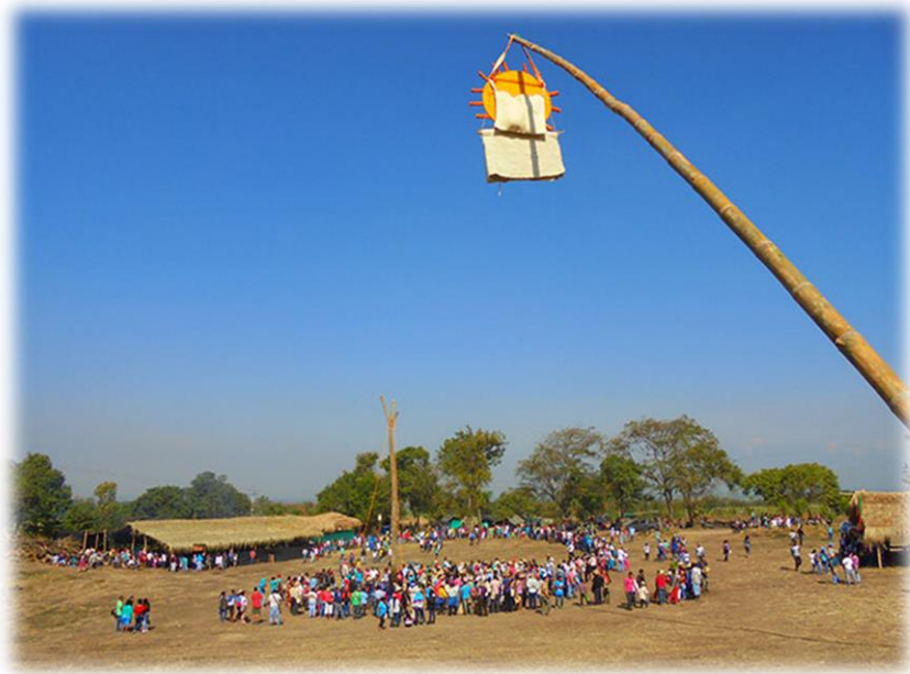
Fotografía 38. Izada de Sek y A`re.