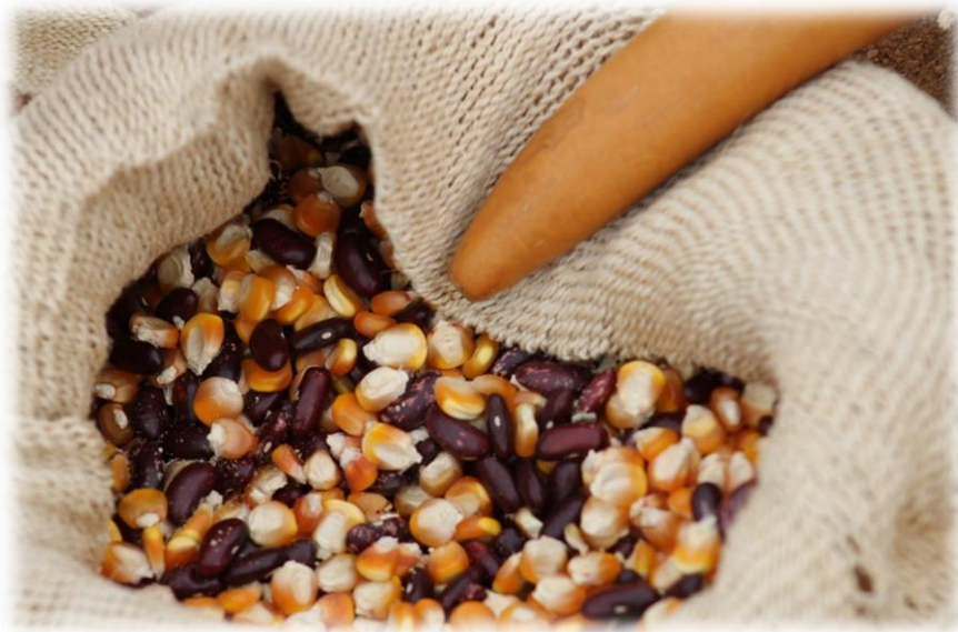
Fotografía 34. Organización de las semillas.

Una vez asegurada y puesta la ofrenda en su lugar, el encargado de atarla se baja del tronco, el Thë' Wala organiza las semillas que han sido llevadas a la llegada del ritual por muchos de los asistentes, que corresponden a los productos que siembran y consumen en sus huertas y parcelas; una vez las entregan, son clasificadas según su especie, por asistentes asignados para esta labor, son semillas de maíz, frijol, yota; son productos que se dan en los variados climas de los resguardos. Después son depositadas en costales para ser repartidas en tercer día del ritual.