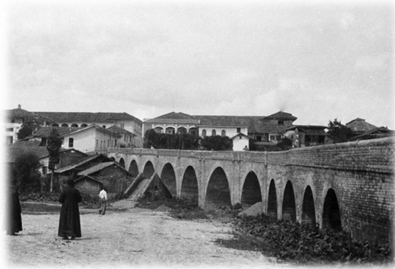
Fotografía 6. Puente de El Humilladero aproximadamente en el año 1930.

La historia de este puente, así como del “Puente de la Custodia”, lo traigo como alegoría de la propuesta de dividir el Cauca en dos departamentos, uno indígena y otro mestizo, idea de la actual senadora Paloma Valencia, argumentando que hay cuestiones de fondo, y entre ellas la de tierras, también porque Popayán no es el Cauca (1), y (2) que el departamento está descuartizado, con regiones desarticuladas hacia el norte, el sur, el oriente y occidente. Propuesta que a la fecha, es el último eslabón de una cadena centenaria de actuaciones de la dirigencia de la capital del Cauca.