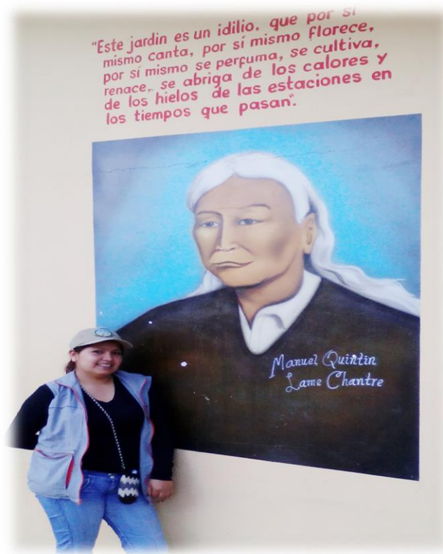
Fotografía 64. Nasa ü'us .