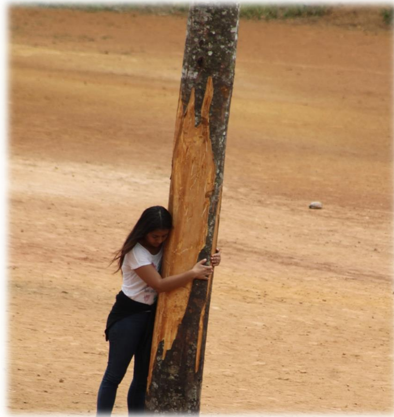
Fotografía 53. Unidos al SAAKHELU 1.

Nos despedimos, el sentimiento de fraternidad y de regocijo se siente y se percibe en cada rostro, en los abrazos y en las invitaciones que recibimos para seguir acompañándolos, porque aunque nos determinen otras realidades y otras prácticas culturales, nuestro corazón se lleva algo de la espiritualidad nasa. Hicimos amigos y grandes compañeros de viaje. Nos llevamos en el interior de cada uno lo que la experiencia nos representó en los más íntimo de nuestro ser. Ya no nos sentimos MSXKA -persona extraña- (véase https://goo.gl/LcrV8E ).