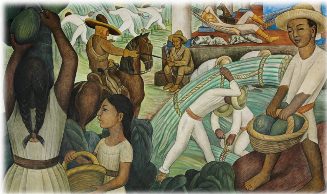
Pintura 4. Caña de Azúcar (1931). Diego Rivera.