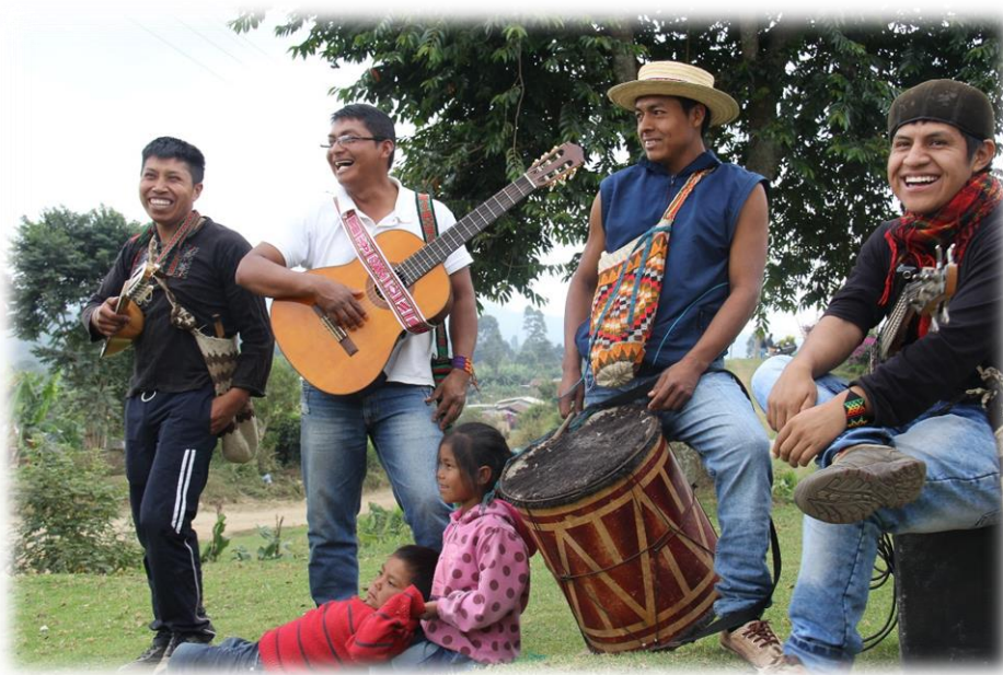
Fotografía 66. Grupo Musical "El Camino de la Torcaza" (wejikigue-wejx).