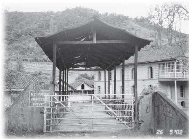
Fotografía 2. Batalla contra el Olvido.

“Aquí se encuentra el pensamiento del hijo de las selvas que lo vieron nacer y que se crio y se educó debajo de ellas como se educan las aves para cantar...porque ahí en ese bosque solitario se encuentra el libro de la filosofía; porque ahí está la verdadera poesía, la verdadera filosofía, la verdadera literatura, porque ahí la naturaleza tiene un coro de cantos que son interminables, un coro de filósofos que todos los días cambian de pensamientos pero que nunca se saltan las murallas donde está colocado el Ministerio de las leyes sagradas de la Naturaleza Humana” (Lame, Q. pág. 71).