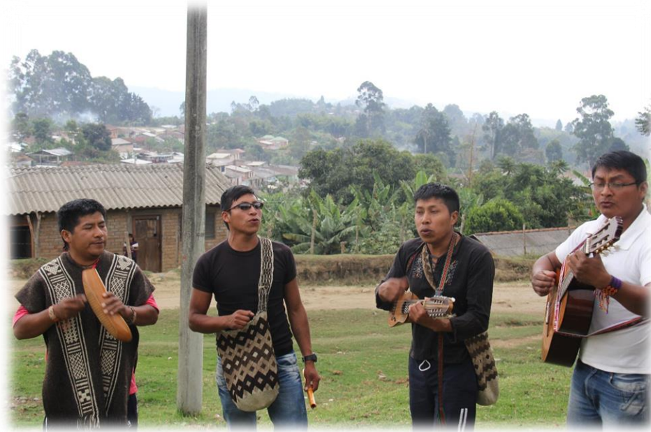
Fotografía 67. Los músicos y sus instrumentos.