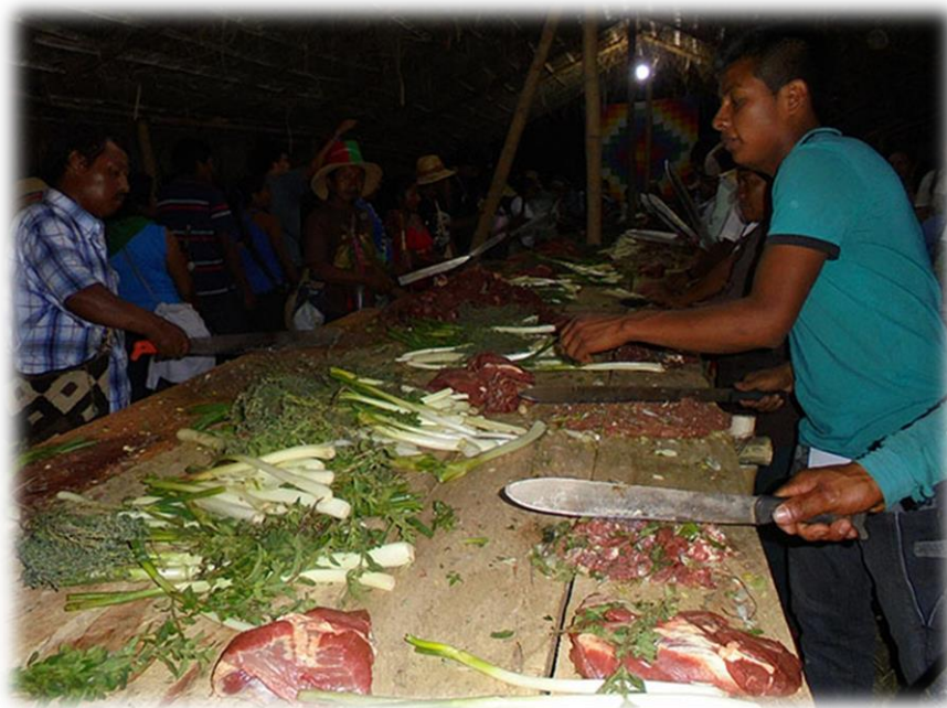
Fotografía 44. Picada de carne 2 (resguardo Huellas 2016) .

A medida que la carne va quedando picada, una persona se encarga de poner cebolla, ajos y sal en cada trozo para que se vayan picando junto con la carne, a medida que los picadores se van cansando, otras personas los van reemplazando y así sucesivamente, puede durar hasta 4 horas.