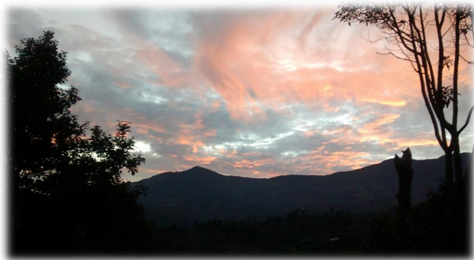
Fotografía 23. Amanecer en la vereda de Buenos Aires, resguardo Pueblo Nuevo.

“El indígena no aprende a leer en los libros sino en la naturaleza” 48