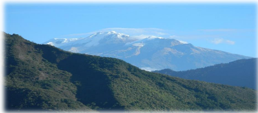
Fotografía 60. Volcán nevado del Huila -municipio de Paéz- .

Entendemos que las lenguas maternas actúan como el mayor mediador en la tradición oral de los pueblos originarios, representan un elemento trascendental para construir y transmitir su cosmovisión y saberes a las nuevas generaciones. La revitalización de una lengua se convierte en la posibilidad de permanencia de una comunidad.