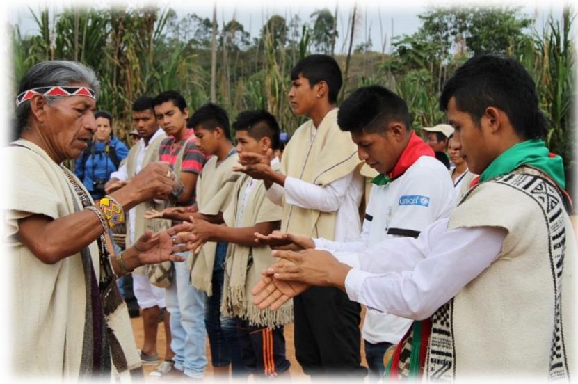
Fotografía 31. Cateo de quienes subirán y bajarán las ofrendas.

Las ofrendas las sube un hombre joven a quien los médicos escogen y refrescan con remedios para que suba mejor de lo que está, ya que es elegido precisamente por tener buena energía; el muchacho se ayuda con una soga para subir y una vez en la cima, amarra primero la cabeza, la cual debe quedar sobre la horqueta, mirando hacia el oriente, hacia Sek , el padre sol; luego ata el costillar y por último la pierna.