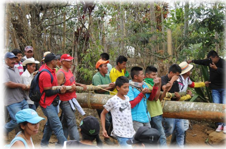
Fotografía 24. Cargada del árbol.

los médicos tradicionales con todos los comuneros hombres que hayan querido participar y con los músicos que no pueden faltar, su música estará presente desde ese momento, -el corte del tronco- hasta el final del ritual”. (Palomino, 2008: 152)