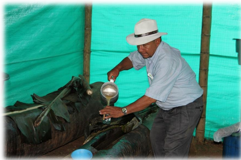
Fotografía 46. Fogones y canoas para la chicha.

Es el ritual el que salva sus relaciones y lo hace fagocitando, es decir, derramando-desde-abajo, tejiendo-relaciones. Es la comida la que nos salva: viene-de-afuera /sabiduría matricial, de comunidades-madres, del dar-de-comer. Es el ritual de la comensalidad, al que siempre están dispuestos y esperando quienes nos reciben en sus casas sencillas. Fagocitando, ser nosotros alimentándonos, nutriéndonos de nosotros mismos, de la tierra que somos. Ser – sur devino en