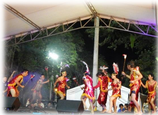
Fotografía 19. Danzas.