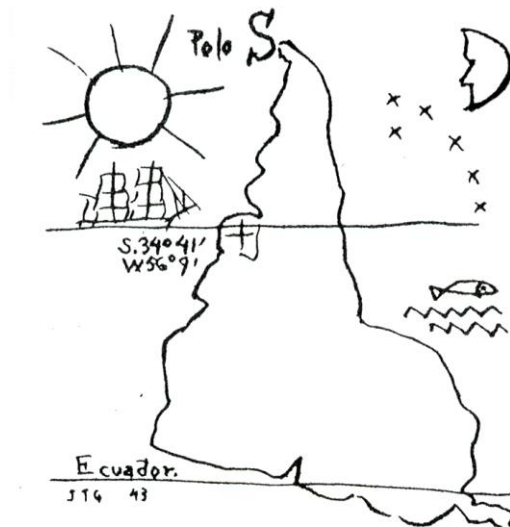
Pintura 1. América Invertida (1943)

El artista Joaquín Torres García en su obra América Invertida de 1943, propone un giro geográfico, geopoético, espacial, temporal, épocal, cultural y civilizatorio.