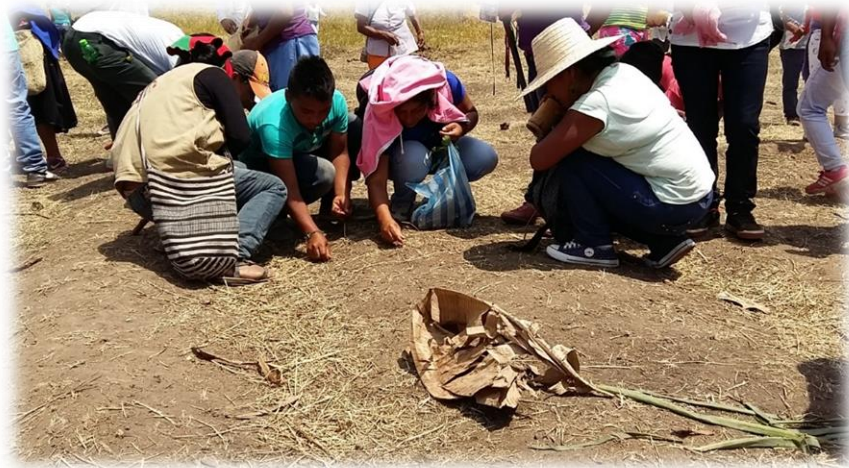
Fotografía 51. Recibiendo las semillas.

La Guardia indígena no solo tiene como función cuidar y defender, sino que su sentido es capacitarse para defenderse políticamente. “Tenemos que defender nuestros sitios sagrados, nuestra Madre Tierra. La Guardia indígena es la defensa de los recursos naturales, hay que comenzar concientizando nuestra comunidad, aprender lo propio y defenderlo para resistir” (CRIC)