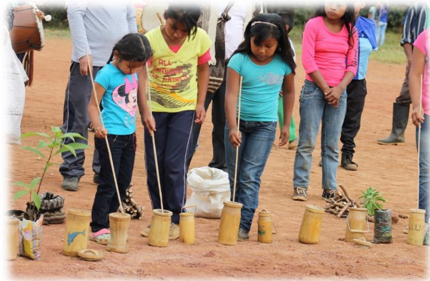
Fotografía 39. Niños despertando las semillas.