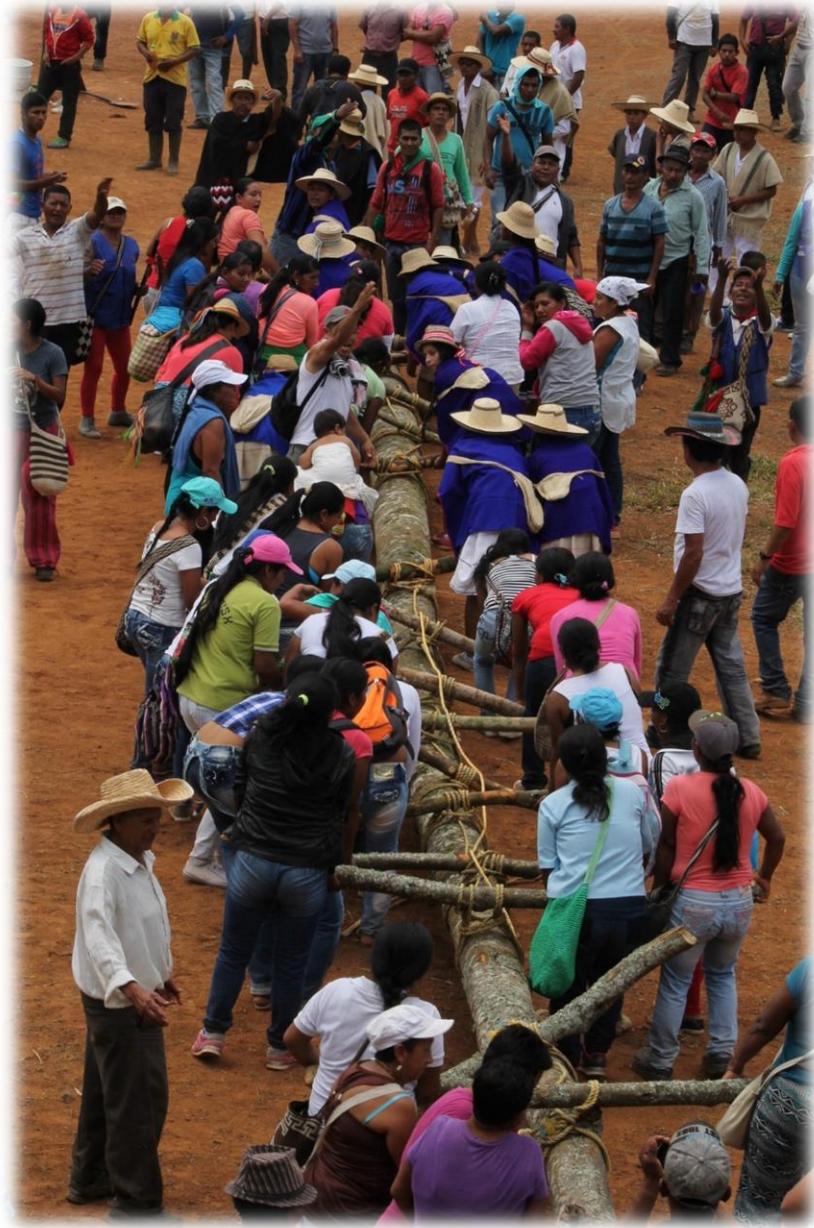
Fotografía 30. Cargada del Saakhelu Resguardo Huellas 2016.

A continuación, se brinda la comida a todos los participantes de esta fiesta, esta vez, asistieron alrededor de 500 personas. Se continúa con los actos culturales alusivos al ritual como lo son la diversidad de semillas, temas sobre la resistencia organizada y la legislación indígena. Thë' Wala se retira para seguir trabajando en la armonización porque de él depende el buen desarrollo del ritual.