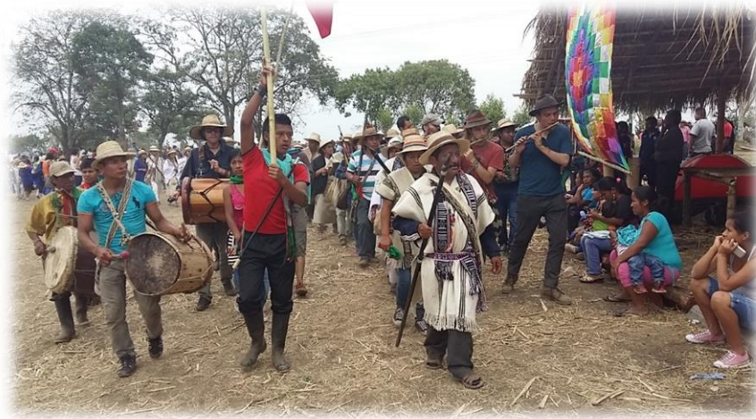
Fotografía 50. Guardia indígena de Corinto . Foto Guardia indígena de Corinto (2015)