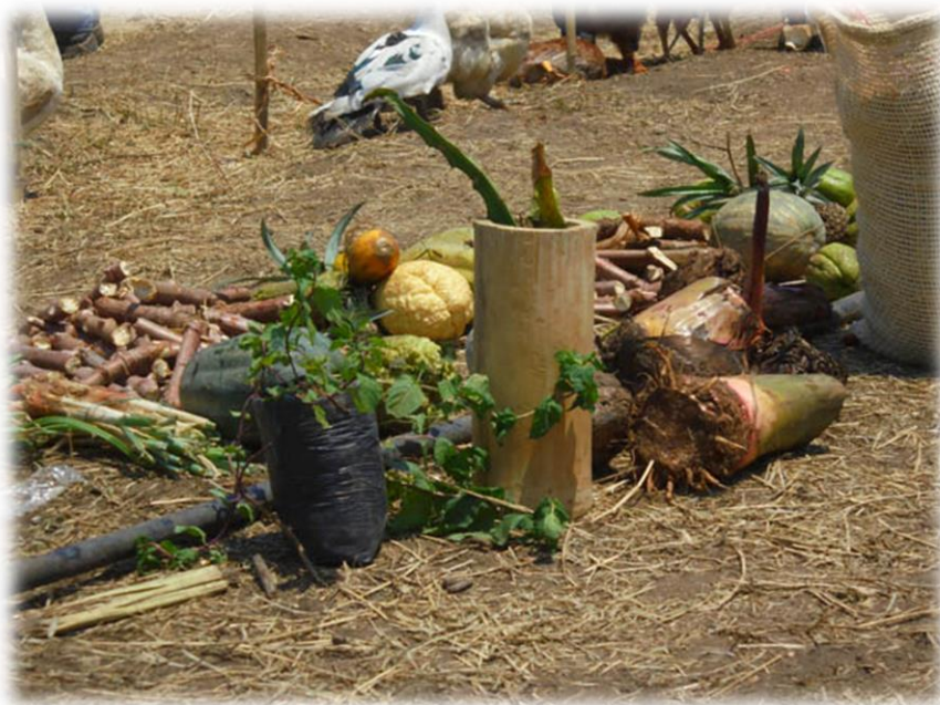
Fotografía 41. Entrega y recibimiento de semillas (resguardo Huellas 2016).