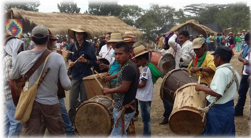
Fotografía 52. Músicos que acompañan el ritual 2015.

Durante los tres días todos nos hemos integrado a las distintas actividades, porque hay que estar en movimiento, para que todos nos vayamos cargados de energía para nuestras casas. En la base de toda la animación, se promueve la unidad, el respeto y el compartir.