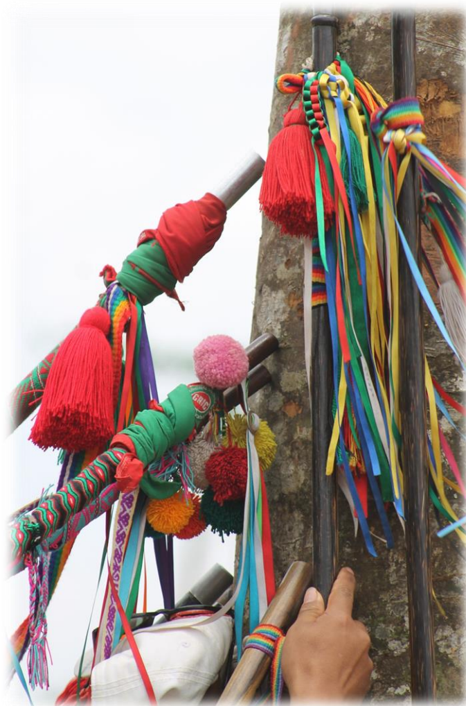
Fotografía 56. Los gobernadores de los cabildos. Sacralizan en el Saakhelu sus bastones de mando (símbolo de justicia, de lucha por lo verdadero).

Fuente: Gladys Giraldo (Corinto agosto de 2015)