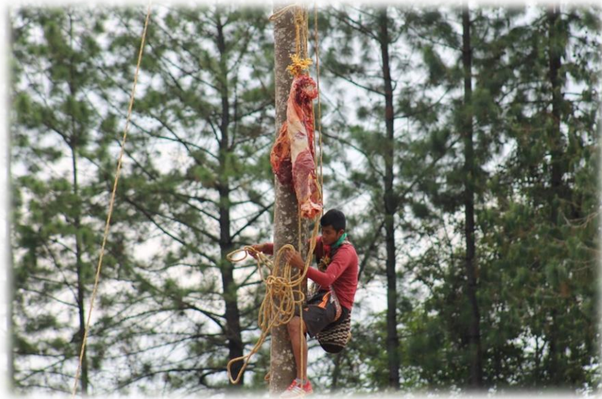
Fotografía 48. La ofrenda al poste mayor 2 (resguardo Huellas 2016).