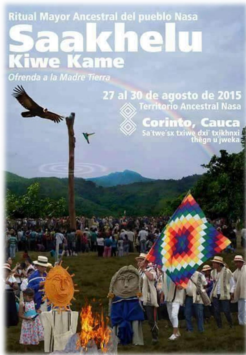
Fotografía 57. Afiche, Ritual Mayor Ancestral del pueblo nasa cabildo indígena de la Universidad del Valle.