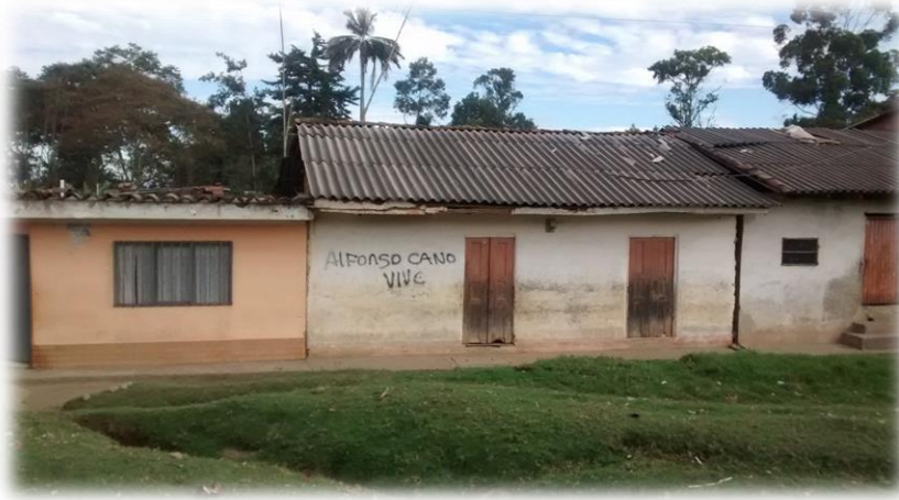
Fotografía 22. Grafiti en la vereda Buenos Aires, resguardo Pueblo Nuevo.

El territorio para el nasa significa “ yat wala txi’ fxiw ” (la gran casa y semilla). Yat Wala (La Gran Casa): la tierra por ser espacio donde se desarrolla, se recrea la vida y por ser el lugar donde vive todo ser (seres humanos, vegetales, animales y minerales), es habitación, hogar vivienda. Txiwe Üus (Corazón de la tierra) es semilla. Es decir, una semilla cambia porque al sembrar se transforma: nace, crece, se reproduce y cambia, vuelve a su sitio de origen, ciclo natural. Por lo tanto, la tierra es semilla, el universo y la tierra son concebidos como Kwe’sx Yat Wala (Nuestra Gran Casa) por ser espacio de vida donde se habita Nwe’sx (familias) pero a su vez es Fxiw (semilla) por ser célula, corazón generador de vida, allí germina la vida. Por eso se dice que el territorio es Kiwe úus “corazón de la tierra”.