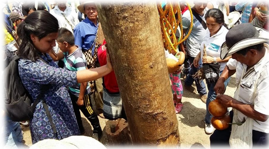
Fotografía 55. Unidos al SAAKHELU 3.