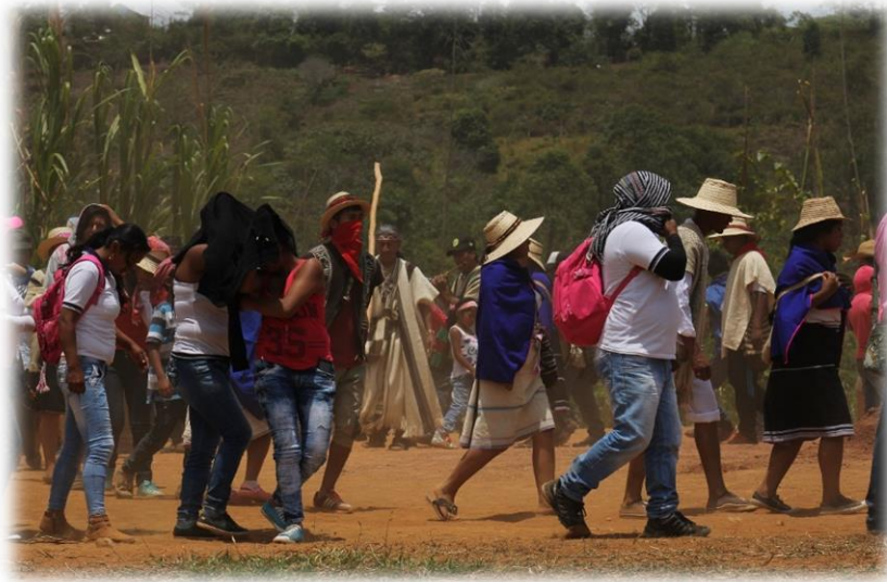
Fotografía 40. La danza de las semillas (resguardo Huellas, 2016)