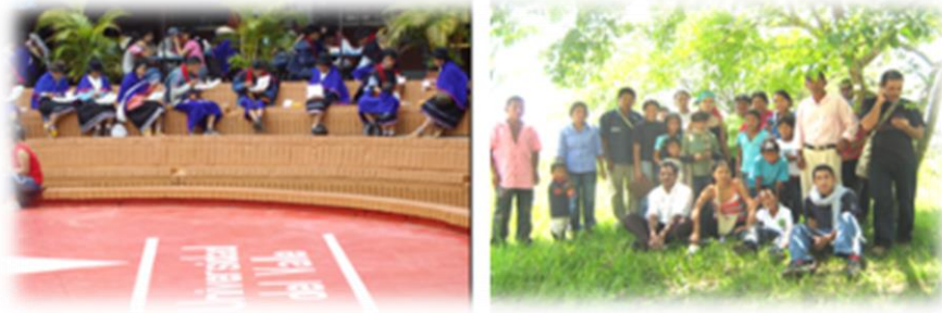
Fotografía 9. Minga .