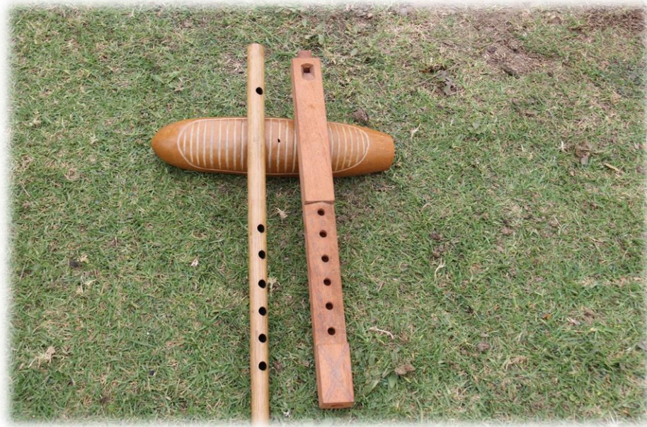
Fotografía 68. Flautas traversas o traverseras.