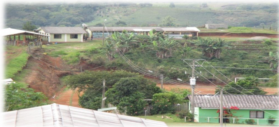
Fotografía 62. Al fondo la escuela "Semilleros de Niños Paeces".

Las recuperaciones anímicas, psicológicas y culturales fueron las más lentas, puesto que la salida forzada del territorio —y la llegada a uno desconocido—, implicó enfrentar nuevos retos, muchos de ellos inéditos. Con decir que en varios sitios no querían la presencia de grupos indígenas. Afortunadamente los morelenses los aceptaron; no obstante la curiosidad que despertaron porque los morelenses contemplaban la posibilidad de conocer gente con “taparrabos”, como en los textos o en las viejas películas.