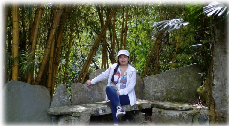
Fotografía 4. Nasa ü'us, Tierradentro 2015

sobreviva a las enfermedades, de esto depende el resto de vida, tiene que ver con el tocar, mirar, cantar, aconsejar y danzar, tal cual como se hace con el maíz tierno. Esto con el fin de formarse como personas autónomas y capaces de liderar procesos en pro de su propia comunidad.” ( Nasa ü'us )