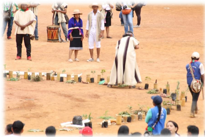
Fotografía 35. Empaque de semillas.