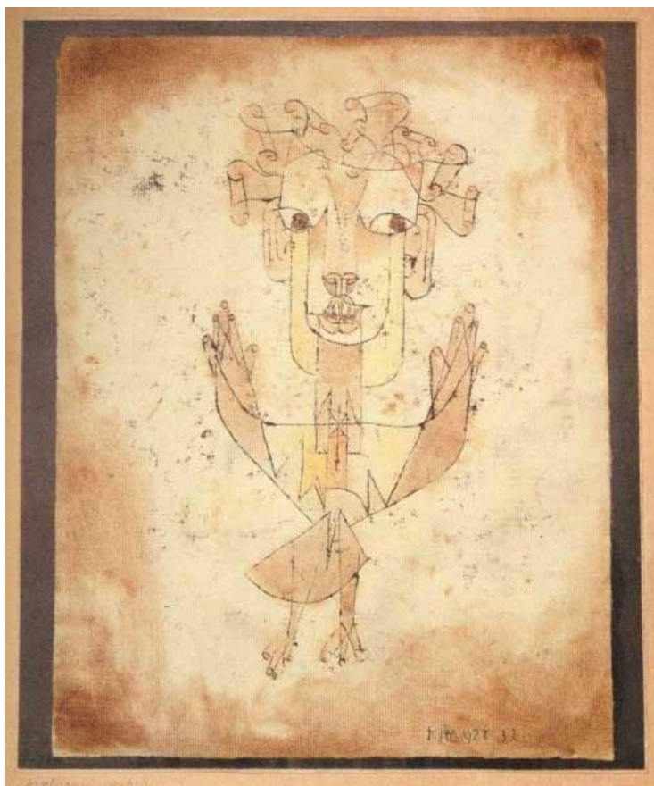
Fotografía 59. Angelus Novus (1920) del pintor suizo Paul Klee. Dibujo a tinta china, tiza y acuarela sobre papel. Museo de Israel en Jerusalén.

Walter Benjamín adquirió esta obra y la llamó "El Ángel de la Historia", así aparece en un ensayo dedicado al escritor austriaco Karl Kraus. La imagen permitía “reconocer a una humanidad que se acredita en la destrucción” (Benjamín, 1998).