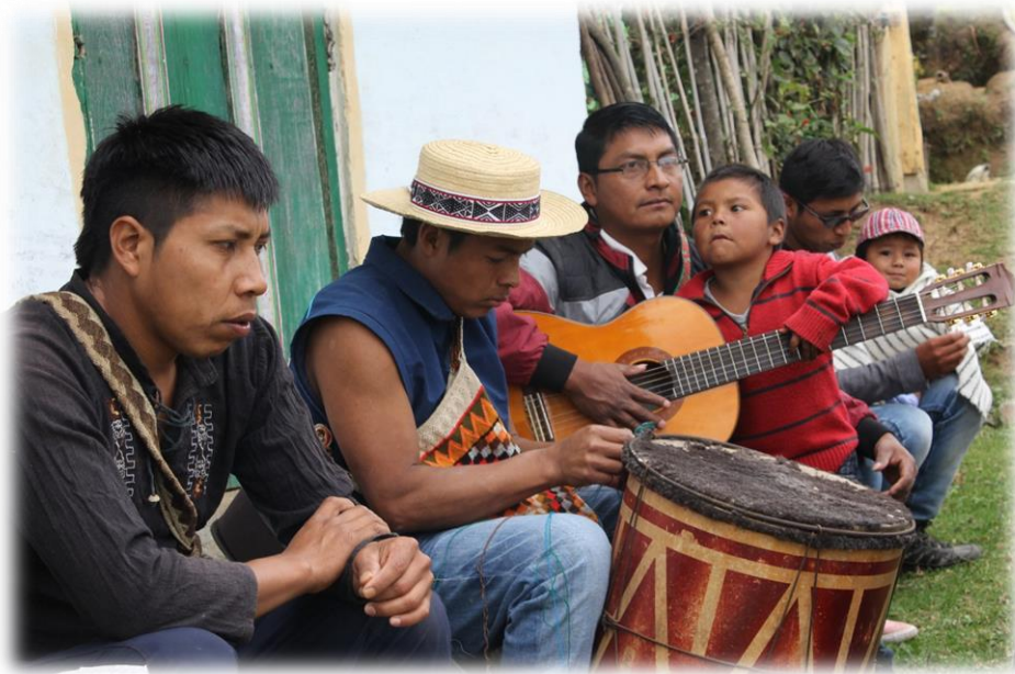
Fotografía 70. Tamborero y músicos.

(...) El tambor, bombo o tambora (recibe todos estos nombres) - Kwêta en Nasa yuwe - es un membranófono de cuerpo cilíndrico y doble parche. El ejecutante se denomina tamborero. Los vasos o cuerpos de madera (en balsa, cabuya o maguey, o yarumo, y a veces una caneca de metal) oscilan entre tamaños de 20cm y 50cm de diámetro. (...)