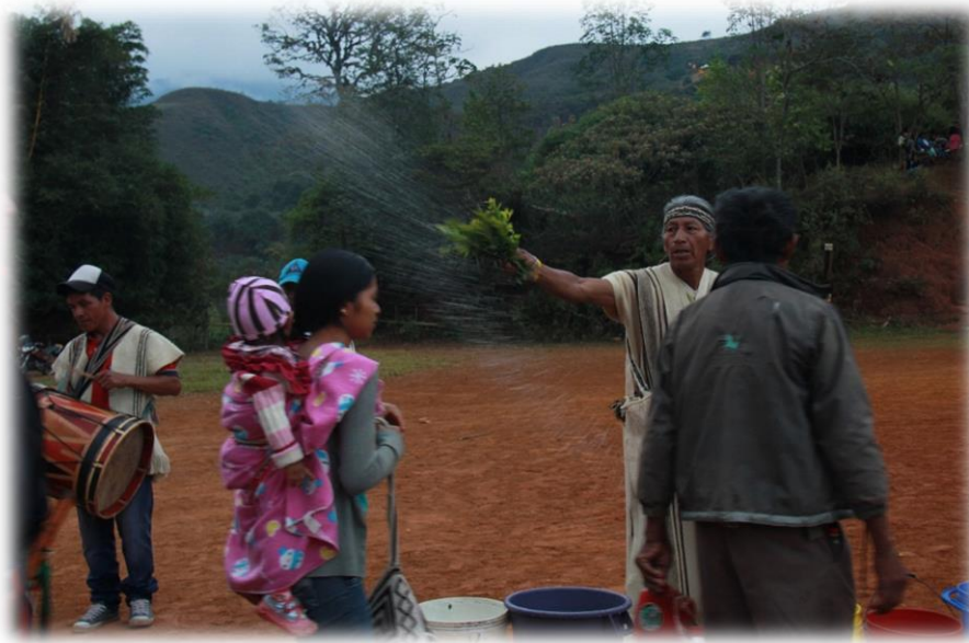
Fotografía 27. Llegada de participantes y refrescamiento 2.

El refrescamiento se hace para recibir buenas energías y deshacerse de las negativas, tanto el lugar como la gente deben estar libres de energías negativas para que el ritual pueda realizarse sin dificultades