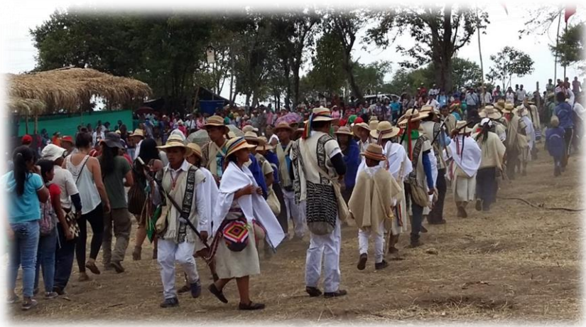
Fotografía 42. La danza de la "culebra verde" Corinto 2015.

formando la figura del animal, para compartir con él, para que en el año llueva de manera equilibrada y lograr el desarrollo óptimo de los cultivos” (Palomino, 2008: 165)