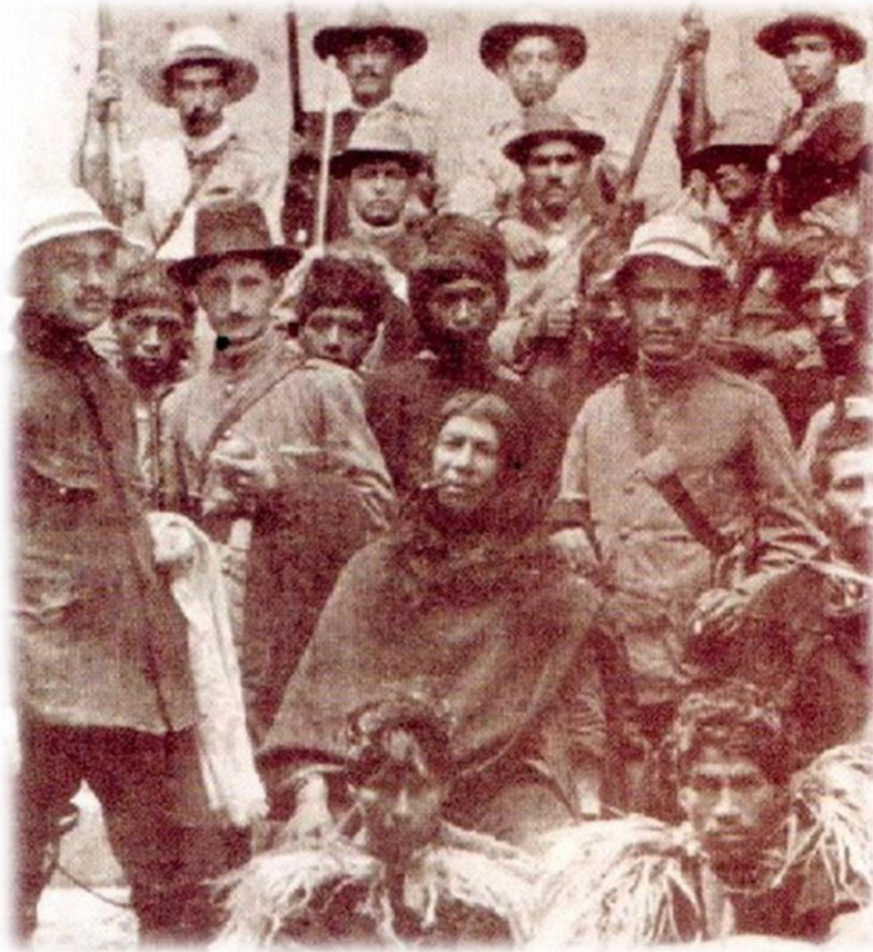
Fotografía 5. Quintín Lame (centro) detenido por la policía colombiana, junto a sus compañeros indígenas de lucha, por liderar un levantamiento rebelde agrícola en El Cofre, Cauca, en 1915.