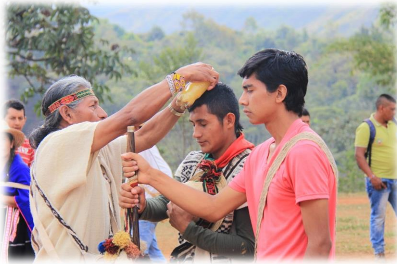
Fotografía 32. Cateo de quienes subirán y bajarán las ofrendas.