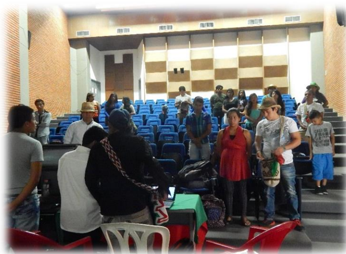
Fotografía 11. Apertura del evento. Fuente: Gladys Giraldo (2015)

El jueves 8 después de un desayuno comunitario, se “ Mambea la Palabra ”.