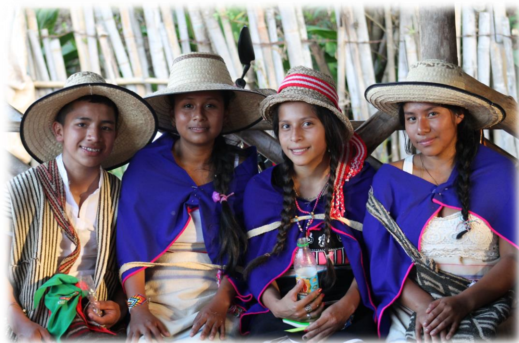
Fotografía 65. Jóvenes nasa que asistieron al ritual del Saakhellu en el Resguardo Huellas 2016.

La individualidad de los jóvenes nasa se teje en la comunalidad de cada resguardo, en la misma medida en que la naturaleza se obvia en el desarrollo espiritual del sujeto occidental. Individualidad que se funde en una geo-comunidad plural, ético-mística; mientras la sociedad moderna llega a sacrificar la naturaleza para el supuesto beneficio del individuo.