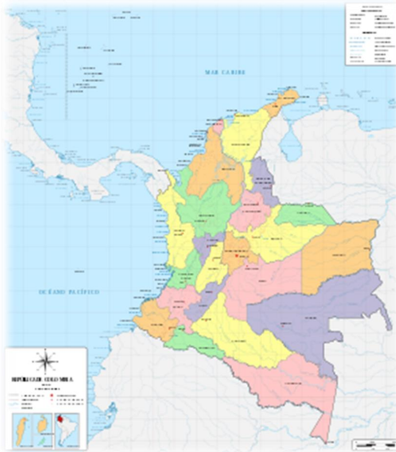
Gráfica 2. Mapa de Colombia 1910.

Desde hace muchas décadas lo que ocurre en el Cauca define el curso de la guerra y la paz. Allí está ocurriendo otro episodio del conflicto territorial, el más extenso y agudo del país, que enfrenta un movimiento indígena radicalizado en una lucha de cuatro décadas para recuperar un territorio históricamente despojado por los anteriores hacendados caucanos y asegurar su existencia como pueblo.