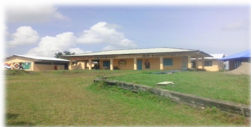
Fotografía 63. Sede de la institución integral de formación e investigación misak.

Posteriormente, la comunidad decide crear su propio cabildo y no seguir como ampliación del territorio del resguardo de Mosoco. Ahora es legalmente constituido como resguardo con el nombre de Muse Ukwe (en honor a Mosoco). Los procesos político-organizativos y comunitarios están en manos del Cabildo.