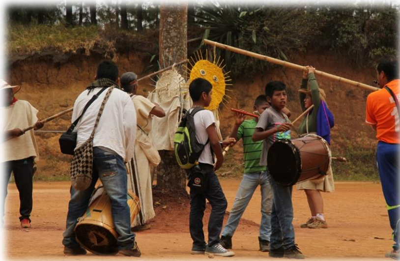
Fotografía 37. Izada de Sek y A`te.