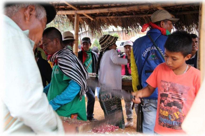
Fotografía 45. Picada de carne 3 (resguardo Huellas 2016).