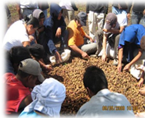
Fotografía 10. Encuentro Mingas .

unión de pueblos, desde los valores y símbolos que enseñan la autoridad, hasta la autonomía y la historia verdadera de nuestros pueblos.