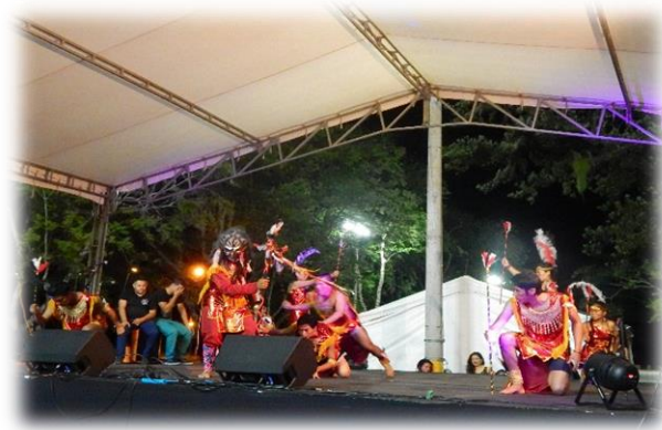
Fotografía 18. Danzas.