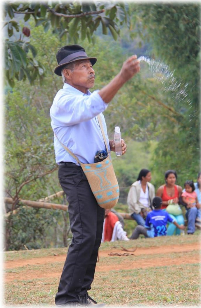
Fotografía 28. Mayor brindando.