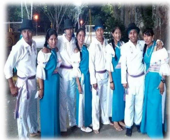
Fotografía 20. Grupo de danzas.