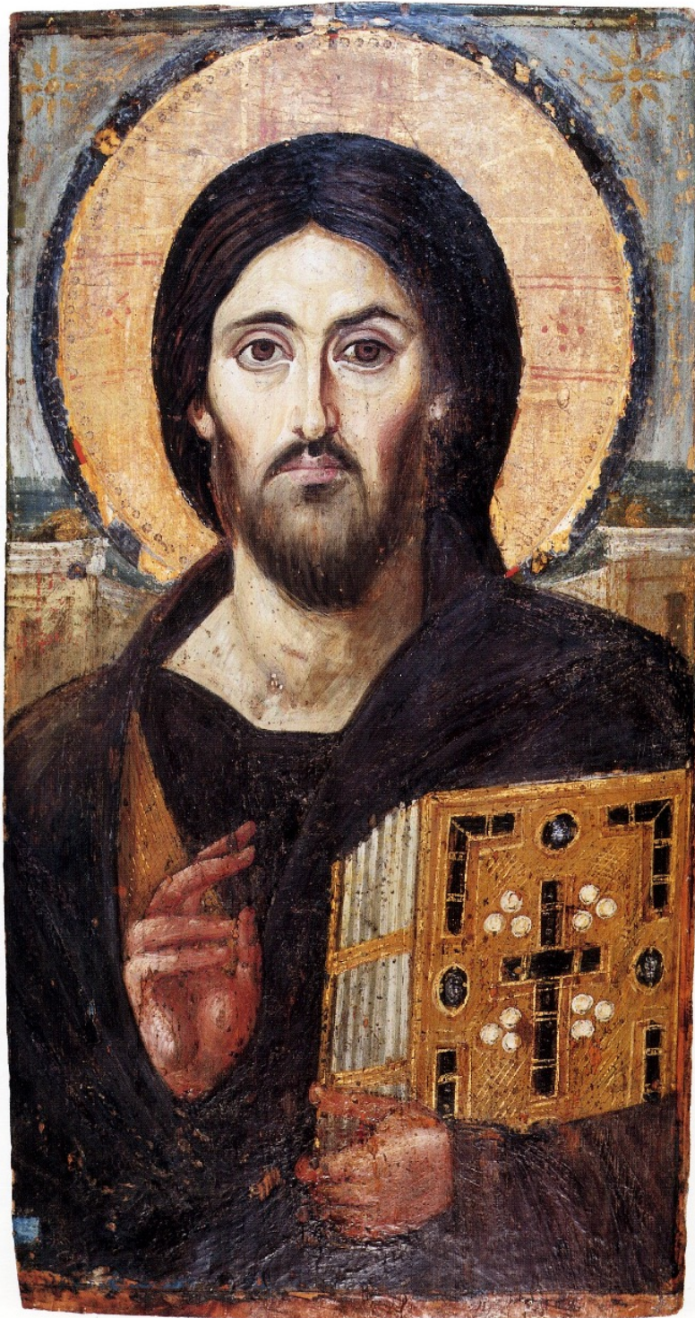
Anónimo. (S.VI). Cristo Pantokrator. Egipto: Monasterio de Santa Catalina del Monte Sinaí.