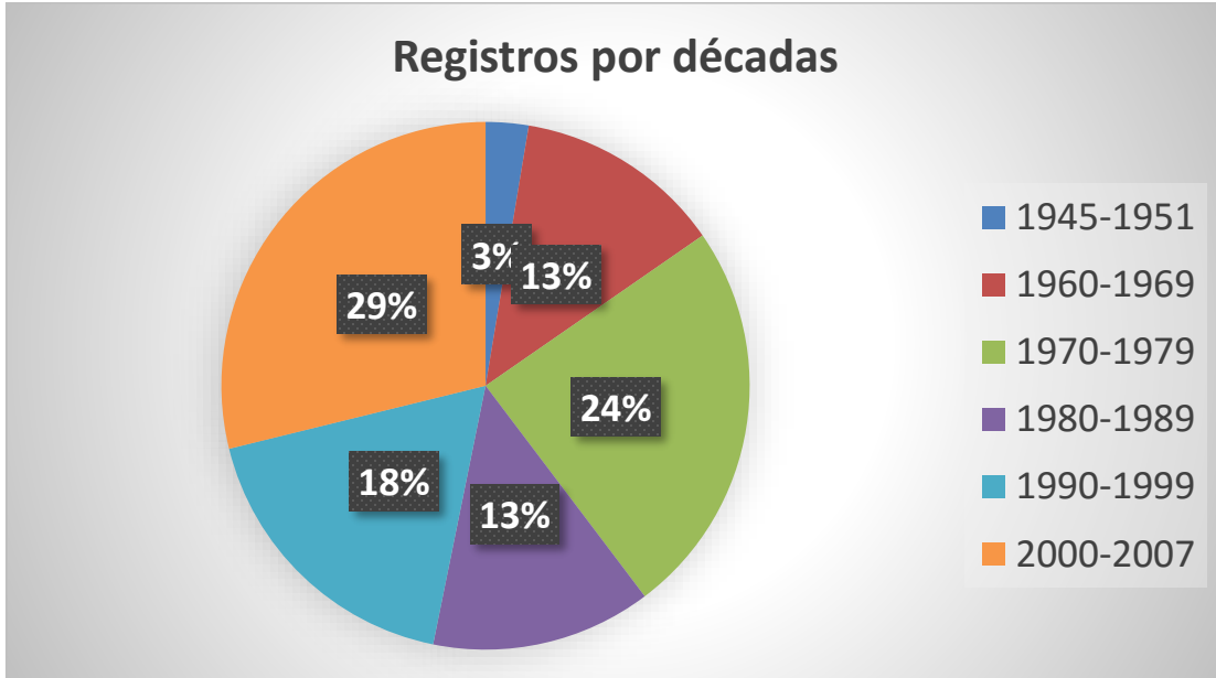
Gráfica No. 1