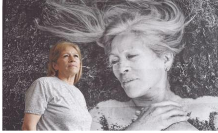
Imagen 6. Madres de Soacha: enterradas por el olvido estatal. El Espectador. 2018. Tomado de: https://colombia2020.elespectador.com/verdad-y-memoria/madres-de-soacha-enterradas-por-el-olvido-estatal

Dicha muestra fotográfica ponía a las madres con el cuerpo resurgido a través de la tierra. Con esta se simbolizaba, para el fotógrafo, el renacimiento y la reafirmación del amor por los seres perdidos (Builes, 2018) 33 . También aludía tanto al nacimiento como a la muerte. Las muestras artísticas se han convertido en una de las estrategias de movilización más utilizadas por las madres y los familiares de estas víctimas, quienes han visto que, a más de una década de sus trágicas muertes, ha sido imposible establecer efectos penales contra los culpables. De modo que las manifestaciones de dolor y las ansias por alcanzar la verdad solo han podido ser decantadas a través de estrategias de la acción que se mueven entre la discursividad y la materia 34 (Barad, 2007). Es decir, con la muestra artística no solo se hace una puesta en común de las historias ocultas, sino que, pese a que las historias son contadas de forma variable, intermitente y discontinua, desencadenan procesos pulsionales en los que la interpelación puede motivar el ejercicio productivo de nuevos sentidos (Suniga & Tonkonoff, 2012, pág. 8)