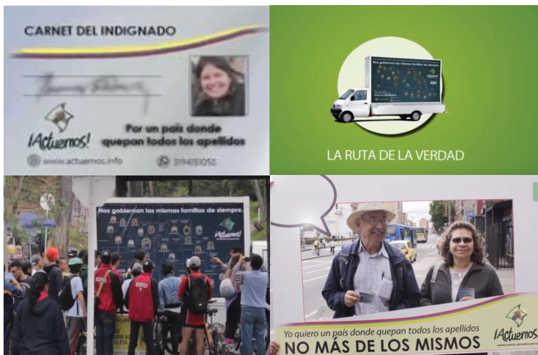
Imagen 10.

Como bien se ha dicho, la desconexión o el desinterés en la participación política ha estado marcado por un desencanto. Desencanto que tiene su origen en las formas en que las instituciones y ciertos mecanismos jurídicos y legales parecen operar en beneficio de unos cuantos. La insatisfacción y la injusticia no solo se convierten en sentimiento de impotencia sino que muchas veces, se traducen en un rechazo, en una rabia frente a todo lo que represente la tradicional manera de hacer política. Identificando pues que el descontento y la fragilidad en el ejercicio político, está mediado por una emocionalidad negativa, que se manifiesta en el alejamiento de la