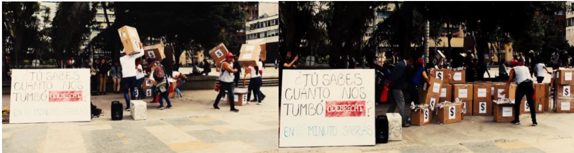
Imágenes 11 y 12. Performance Odebrecht. Parque Santander.

clientes potenciales y la manera en que la política hace un llamado a la veeduría ciudadana. Desde allí se intentaba reafirmar el papel del colectivo como revelador de ‘las relaciones del poder y la corrupción en Colombia’.