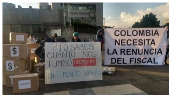
Imagen 14. Montaje performance Odebrecht. Bunker de la fiscalía.

por muchas razones debían transitar por esa calle. La escenificación se repetiría unos días después frente al Bunker de la fiscalía, en la 26. Lugar al que convocarían las ‘ciudadanías libres’ para reclamar la renuncia del fiscal, cada vez más enlodado en el caso. Ya no con un guion claro, la ambientación serviría de foto contextualizante de la protesta que se extendió espontáneamente en varias ciudades del país.