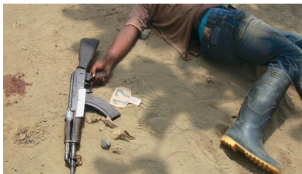
Imagen 1. ‘Falsos positivos’ aumentaron más del 150% con Uribe. 12

En el marco de la “Seguridad democrática” el entonces presidente Álvaro Uribe Vélez, a la vez que declara el estado de conmoción interior, dicta toda una política de seguridad nacional integrando tres focos de atención: una gran ofensiva militar contra las FARC, una “política de paz” con los paramilitares, así como una estrategia de