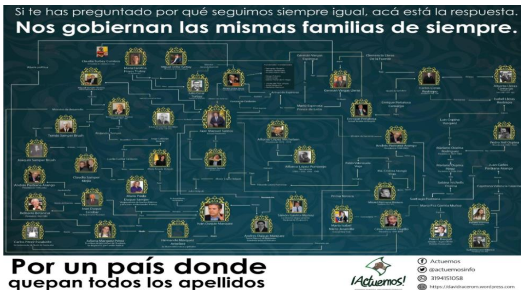
Imagen 8. Mapa del poder de Duque.

La titulación del afiche logra presentar, además de la relación entre rostros conocidos de la política, una distinción gramatical que se remarca mucho más a través del discurso: nosotros/ellos. A lo mejor, tal enunciación del “nosotros” alude a lo que Butler reconoce como una lucha por ampliar la idea de los derechos más allá de una construcción universal abstracta. Esta oposición no solo plantea una distinción entre amigos-enemigos, lo que revela es, inicialmente la necesidad de interpelar la figura de la individualización creada por el derecho privado, perpetuada por el capitalismo e introducida en la cotidianidad de la vida a través de prácticas neoliberales. Así, aunque el “yo” se establece como un referente de normativización, de organización del mundo, de aislamiento de “lo otro”; es en la conversación entre el “yo” y el “otro” que se pueden consolidar nuevas alianzas y se puede aludir a unas regulaciones afectivas que hablen del “nosotros”. Dichas regulaciones también develan una política de lo cotidiano, que