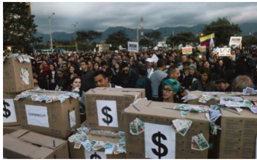
Imagen 15. Montaje performance Odebrecht. Bunker de la fiscalía.

Mientras algunos medios de influencia, como la W utilizaron la imagen para mostrar un escenario solitario, otros medios como ‘Pacifista’ la antepusieron como un símbolo del hartazgo de la ciudadanía ante las situaciones de corrupción.