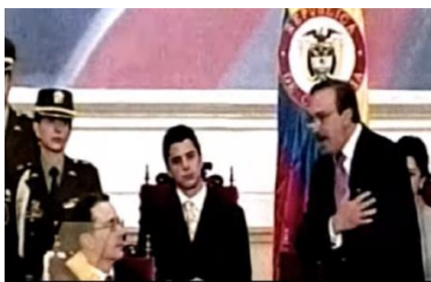
Imagen 2. Memorias del embrujo/ los primeros días. YouTube. 2020.

El seguimiento a determinados roles es para Goffman, una característica central de lo que es susceptible de observarse como performance. Por lo tanto, dado que los roles pueden ser ejercidos como personajes o máscaras que varían de acuerdo a los usos, su análisis siempre tendrá que hacerse a la luz de impresiones y códigos en los que se cruzan tanto elementos lingüísticos y comunicativos, como referentes culturales e ideológicos. Dichas impresiones, según lo asegura el sociólogo guardan una identidad ambigua de los personajes, pues pueden ser auténticas o artificiales (Goffman, 2001, pág. 15). Por esto, aunque el intercambio se dé como una actividad perlocutiva 20 , nunca es posible hacer un ejercicio diáfano de interpretación; más bien se ponen en juego significaciones que pueden ser producto de deseabilidades o representaciones (Alexander J. , 2011). Si bien es cierto que la guerrilla de las FARC se encargó de acuñar con sus propias acciones un rechazo nacional, la plataforma comunicativa montada sobre su imagen desdibujó el trasfondo histórico de su papel político. El impacto que tal rechazo tuvo, caló fuertemente en los imaginarios o significantes relacionados con la subversión o la oposición política. A esto se agrega lo que Alexander señala acerca de los sistemas de representaciones colectivas, los cuales incorporan