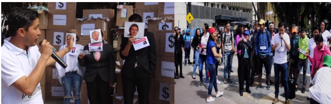
Imagen 13. Performance Odebrecht. Parque Santander.

Así, el recorrido inició en la sede ‘Actuemos’ (carrera 14 con 19), lugar donde teníamos ubicadas las cajas de la ambientación y desde donde tuvimos que transitar casi unas diez cuadras por toda la calle 18, para llegar a nuestro destino. En perspectiva, el desfile se veía como una jornada de descargue en donde operarios del común llevaban cajas al hombro, que llamaban la atención por el montón de billetes – y que aludían a la cantidad de dinero repartido ilícitamente- y por la relación que estos tenían con Odebrecht. Nombre que había impactado mucho en los titulares noticiosos de los últimos días y que se relacionaba tímidamente con situaciones de corrupción de las cuales era muy difícil dar cuenta. Por el camino, nos cruzamos con ciertas caras de sorpresa, otras de indiferencia y otras de reconocimiento de lo que la escena implicaba. Algunos comentarios de los transeúntes o de los empleados de los negocios eran precisamente: ¿qué van a hacer con toda esa plata?; al devolverles la pregunta una sonrisa de ironía se dibujaba en sus rostros, respondiendo como un: “qué no haría con todo ese dinero”.