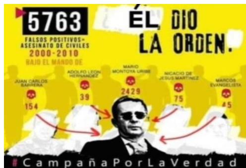
Imagen 5. Reproducción digital de la censura del mural: ¿Quién dio la orden?

que la orden no haya sido un acto enunciativo directo, sino que se dio como un mensaje implícito respecto a lo que la estadística de las muertes podía movilizar en una audiencia nacional.