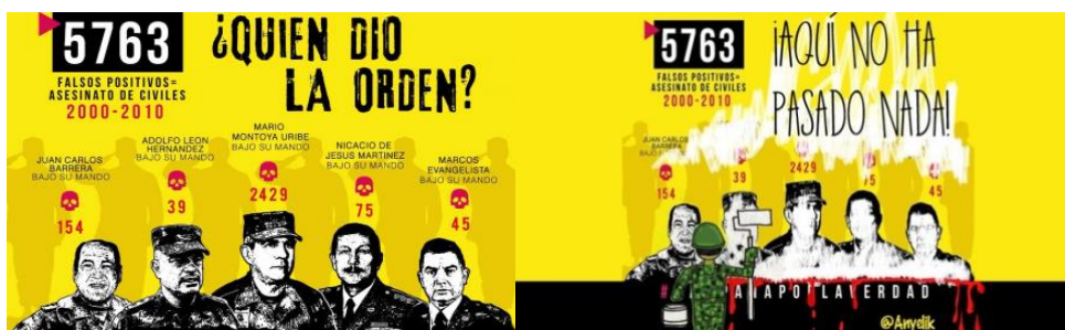
Imagen 3. Reproducción digital mural: ¿Quién dio la orden? Movice.