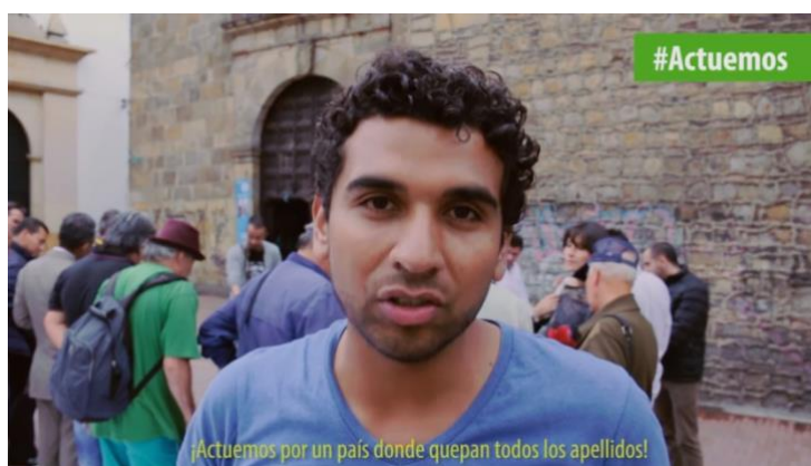
Imagen 7. Video ¡Actuemos por un país diferente!

¡Por un país en el que quepan todos los apellidos! Es el lema con el que el colectivo de jóvenes ¡Actuemos! Empieza a hacer su aparición en el espacio público. Lo hace con una firme convicción: “romper el sentido común” desde el cual se ha manejado la política en el país. Estos jóvenes, muchos de ellos docentes universitarios, procedentes de diferentes disciplinas e hijos de una generación apaleada por un conflicto de muchas décadas, se organizan, inicialmente, como un grupo de amigos y luego como un colectivo político. Lo hacen con la primera intención de acompañar el proceso del plebiscito por la paz efectuado en el 2016.