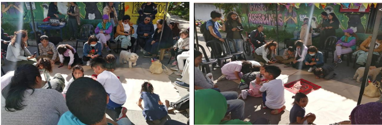
Juntanza, Escuela Popular Patas Arriba

Nota. Imágenes propias, tomadas en la Casa Cultural de Potosí, Ciudad Bolívar, Bogotá, 2024.