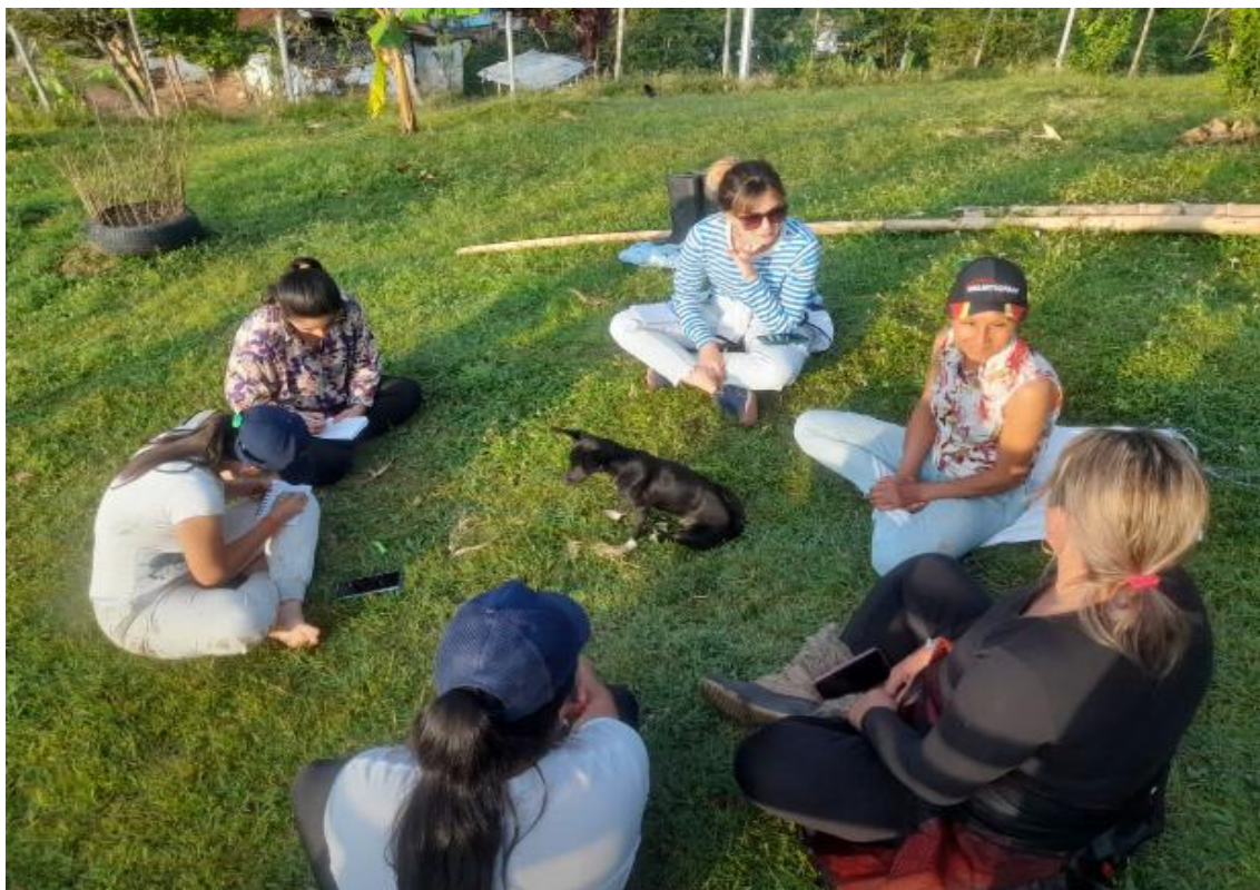
Nota. Imágenes propias, 2022.