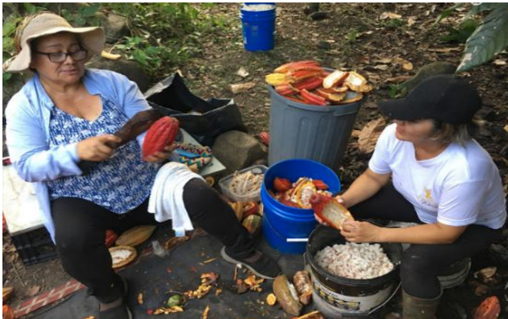
Cogida de cacao