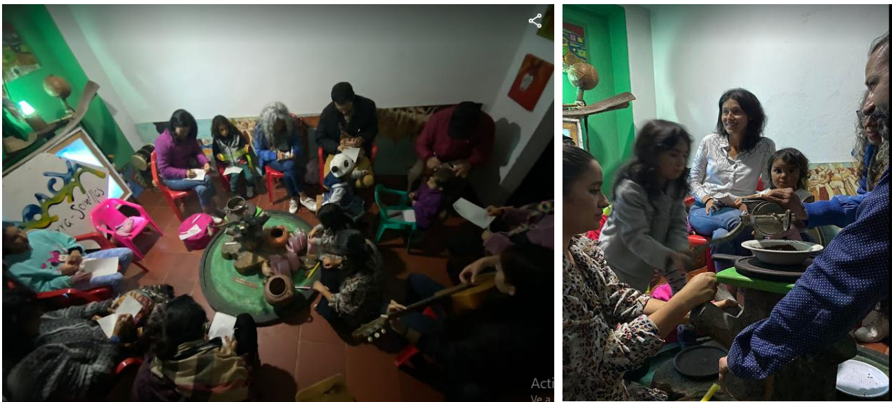
Juntanza memoria del cacaco

Nota. Imágenes propias tomadas en la Casa Aquya, 2023.