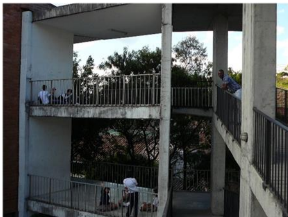
Fotografía 4 Estudiantes en descanso, siempre bajo la mirada de un maestro

Al maestro se le ha encargado otra responsabilidad adicional a enseñar, en él recae de alguna manera el compromiso otorgado por un superior (rector o coordinador) la tarea de observar de manera permanente las acciones de sus educandos, por tal razón es indispensable que sea él quien tenga el control sobre cada momento de la vida escolar, llámese tiempos de clase o bien espacios libres (descansos). “El estado me dice que yo tengo que cuidar, un ministerio de educación nacional me dice no se olvide que a la hora del descanso usted tiene que ejercer la disciplina y tiene que estar