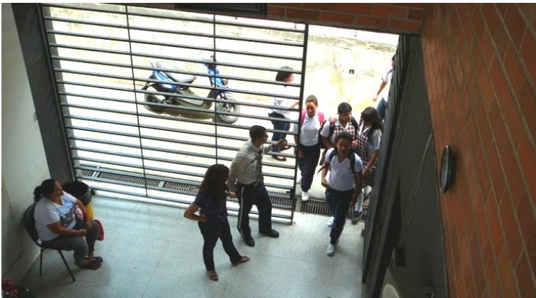
Fotografía 3. Aplicación de la vigilancia al ingreso de los estudiantes a la institución educativa.

El alumno se reconoce así mismo como culpable y se ve obligado a asumir que debe tener otros tipos de comportamientos que sean adecuados a lo que se espera que él sea. La corrección de lo que se es, inicia desde el reconocimiento de la culpa, la manifestación del deseo de cambiar, y el saber que hay un registro de la falta cometida que ya le otorga el título de infractor, poniéndolo en situación de obtener una sanción más fuerte si reincide. La culpa se manifiesta como un sentimiento interno que señala la desviación y el auto reconocimiento como infractor, se instala como parte de la vigilancia jerárquica y de la sanción que normaliza, pues ya no se es sólo culpable ante los demás, sino ante sí mismo, lo que puede desembocar en comportamientos que ya no sólo vienen del exterior sino también del interior del individuo y que van dirigidos a la normalización, a la aceptación de lo que debe ser y dejar de ser quien está siendo. De ahí que puede inferirse que lo que entiende la escuela como logro alcanzado es la obediencia, por tanto, no ha reflexionado en su función productora de sujetos dóciles en contraposición con las urgencias sociales y políticas de sujetos participativos.