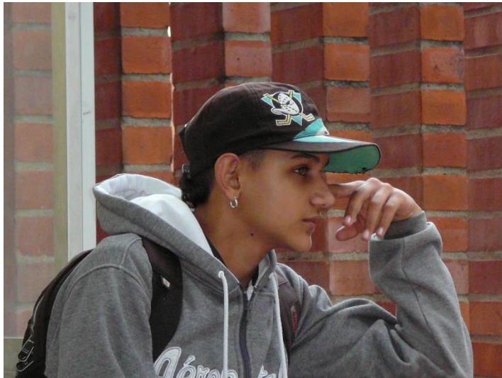
Fotografía 2. Estudiante en el aula de clase portando aretes y gorra. Elementos que están prohibidos usar.

Se asiste a la configuración de un sujeto que se resiste, que reclama sus derechos ante las prácticas de poder que los desconocen, que manifiestan sus pensamientos, deseos e identidad a través del cuerpo. Un sujeto que participa de la construcción de sí en contra de la norma, pero no en la construcción de normas de manera democrática que atiendan al interés de la comunidad.