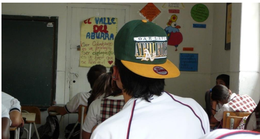
Fotografía 8. Un estudiante recibe la clase en el aula portando aretes y gorra.

Este cuerpo disciplinado representa a un tipo de sujeto ideal que se pretende obtener a través de la educación. Un sujeto sin rostro, extraño para sí mismo porque corresponde con la exterioridad, lo que viene dado desde afuera y no como una producción interna de quien es sujeto en su cuerpo.