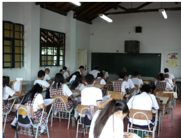
Fotografía 1. Arquitectura del aula de clase

La estética de los alumnos está definida por el uniforme que lo deben portar de manera obligatoria y que se considera fundamental para la labor educativa que realiza la escuela. Según el Manual de Convivencia es deber de los estudiantes: “Tener una buena presentación personal, utilizar el uniforme que corresponda, sin mezclar prendas del uniforme de diario con el de educación física” (artículo 18, numeral 4) .Las acciones de los estudiantes que no corresponde con lo establecido en las normas institucionales son consideradas faltas, las cuales tienen un tratamiento que incluye llamados de atención oral por parte de los profesores, registros escritos en el observador de comportamiento, llamadas a los padres de familia o acudientes y suspensiones de las labores académicas.