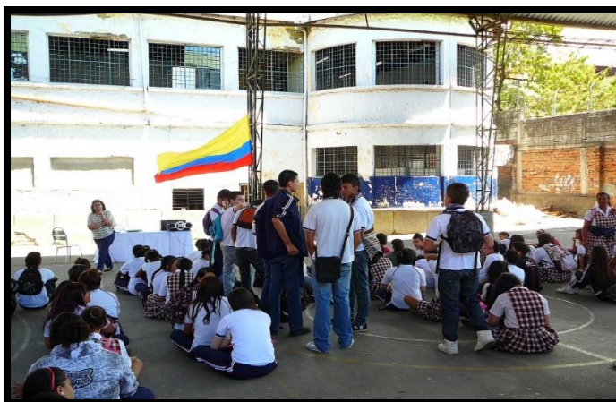
Fotografía 5 Patio del colegio con estudiantes participando de un acto comunitario.

Al hacer en este ámbito un reconocimiento de los contextos particulares y concretamente a la escuela que convoca el proceso investigativo, se realizaron una serie de acciones que permitieran desde el modelo metodológico de la investigación adentrarse en las particularidades del contexto, de los individuos, de sus relaciones y manifestaciones en torno al cuerpo, el poder y la disciplina. Siendo así se recurre a diversas estrategias que adquieren relevancia para este reconocimiento, entre ellas: el diálogo con los alumnos y docentes, las fotografías de diferentes manifestaciones individuales y colectivas, las observaciones a distintos momentos de la vida escolar, la revisión y seguimiento a registros institucionales de control. Como producto de esos ejercicios se presentan una serie de elementos que afirman que las conductas mencionadas aún están afincadas en el ritmo diario de ella, por ello haré uso de algunas imágenes, relatos o diálogos recopilados para presentar los elementos hallados en relación a dicha reflexión.