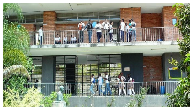
Fotografía 14. Los estudiantes hacen un recorrido más largo antes de llegar a clase

Comportamientos que se consideran de indisciplina como quedarse por fuera del aula, escuchar música en clase, no prestarle atención al profesor o no realizar las actividades