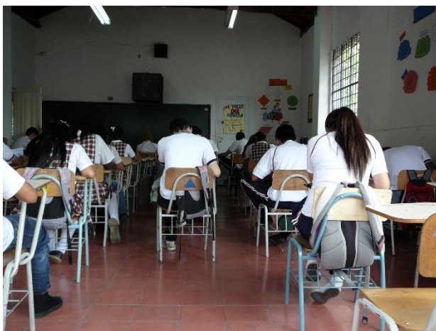
Fotografía 1: Aula de clase, disposición del grupo para participar de una sesión de trabajo.

En la fotografía 1, es posible notar la importancia de disponer el cuerpo dentro del aula de clase para favorecer el orden, la disciplina y el control dentro de la misma. En ella se observan elementos tales como: cuerpos alineados en el espacio, uniformados, con una actitud podría pensarse un poco pasiva desde su disposición para el desarrollo de la clase, permanecer en orden dentro del aula es para el maestro una señal de respeto hacia él, ocupar el lugar que le