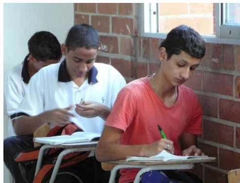
Fotografías 10 y 11. Estudiante realizando actividades escolares

En la postura de Foucault sobre el poder, se establece la existencia de la libertad como posibilidad de resistencia al interior de las relaciones de poder, pues señala que aunque existan prácticas y discursos que configuran subjetividades de acuerdo a determinados dominios de poder y saber, siempre es posible poner en juego puntos de insubordinación, de escapatoria, grietas que se abren sobre aquellas prácticas que determinan lo que somos, y es precisamente esto lo que evidencian alumnos y profesores en sus prácticas.