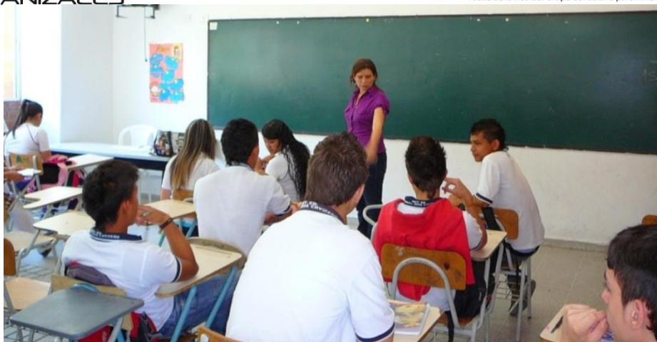
Fotografía 5. Desarrollo de una clase con el orden jerárquico que se establece entre la maestra y los estudiantes.

En las aulas la arquitectura está definida para que la atención de los alumnos se dirija hacia el mismo punto, alineados en filas, cada uno en el lugar que le fue asignado para garantizar el orden y evitar los comportamientos que puedan interferir en la clase, todos mirando al frente donde está el tablero y donde se ubica el maestro para dictar la clase. La arquitectura está diseñada para que se pueda hacer vigilancia de los alumnos y para esto se hace necesario que siempre estén acompañados, bien sea en las aulas cuando están en clase o en los otros espacios durante el descanso. El maestro figura como el sujeto al cual le corresponde disciplinar a los alumnos con su mirada vigilante, su derecho a sancionar, corregir y castigar. La arquitectura de los espacios permite que esta tarea se cumpla, pues mantiene a los estudiantes en un sentimiento constante de estar siendo vigilados, controlados y encerrados entre rejas y muros altos que no permiten esconderse o escapar pero sí ser visto. En la siguiente imagen se puede apreciar cómo un profesor se sale del aula de clase que es muy estrecha y calurosa, pero ejerce vigilancia sobre los alumnos observándolos a través de la ventana para garantizar que están realizando las actividades que se les propuso y que no cometan faltas de disciplina.