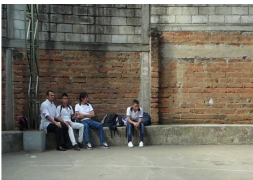
Fotografía 4. Vigilancia durante el descanso

Durante el descanso los profesores están distribuidos por la institución en lo que se denomina “acompañamiento a los estudiantes” y busca fundamentalmente vigilar para que no se cometan faltas de disciplina. Los espacios para permanecer en el descanso están determinados y esto incluye que hay otros que están excluidos, como las aulas y baños; al igual que las actividades que están o no permitidas, por ejemplo, solo se puede correr en la cancha y no permitidas, por ejemplo, solo se puede correr en la cancha y no en los corredores.