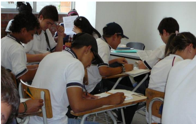
Fotografía 12. Desarrollo de actividades en clase. Los estudiantes realizan la actividad que el profesor les pidió y mientras usan elementos que se consideran faltas de disciplina como lo son las gorras.

cuaderno pues están las actividades... el tipo tuvo como responsabilidad para hacer las actividades". (Profesor de educación media)