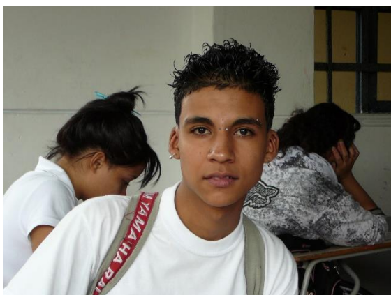
Fotografía 3 Estudiante haciendo uso de aretes y varios pircing. Elementos restringidos por el manual de convivencia escolar.

Si nos damos a la tarea de interrelacionar estas acepciones de cuerpo con nuestro interés en la escuela, podríamos percibir elementos importantes, uno de ellos está relacionado con su complejidad, pues es entender que el cuerpo supera los asuntos meramente fisiológicos, de movimiento o de estar; en el cuerpo se denotan todas aquellas emociones, sentimientos, pensamientos, interrelaciones que surgen desde lo individual y trascienden al ámbito colectivo, y que precisamente en esas interacciones es donde cada uno tiene la posibilidad de comprender y asimilar el mundo desde una perspectiva individualizante. Sin embargo se encuentra de manera paradójica una situación relacionada con la necesidad de poner en el cuerpo matices de productividad, desarrollo y principalmente de desarrollo económico, lo cual denota que desde instancias como la escuela es necesario formar o moldear el cuerpo para que responda a ese requerimiento.