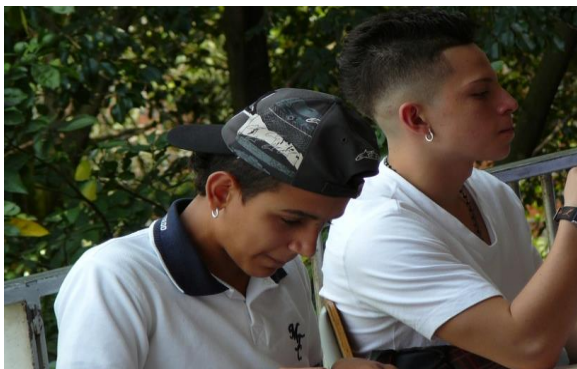
Fotografía 9. Estudiantes realizando actividades escolares portando elementos que se consideran faltas de disciplina

Si bien estas prácticas de gobierno que hacen parte del poder disciplinario tienen cabida en la escuela de la manera como han sido presentadas, también es preciso ubicar la resistencia que se le hace por parte de los profesores y de los estudiantes. De esto nos ocupamos en los apartados siguientes.