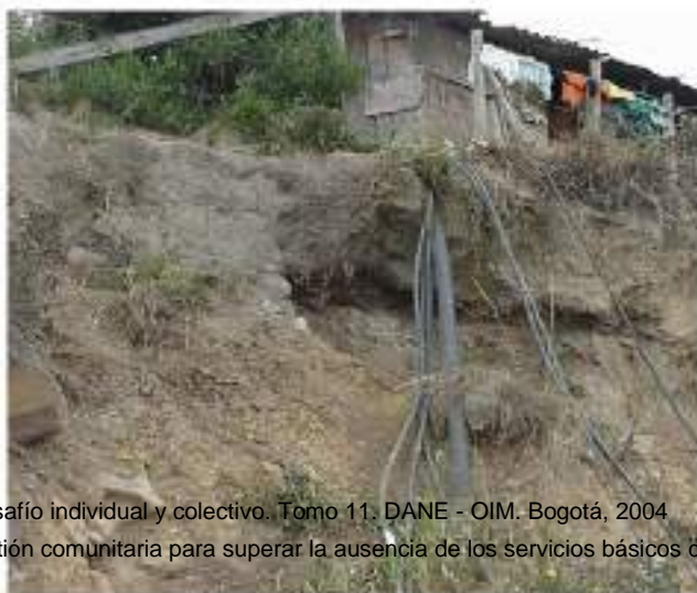
Mangueras para el Aprovechamiento de Agua en una Vivienda en la Zona de Altos de Cazucá

.Mangueras superficiales hechas de materiales no apropiados, de