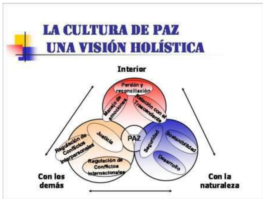
Ilustración 5. Benavidez. (s.f.). La cultura de paz, una visión holística. Figura. Recuperado de: Benavides de Pérez, A. Educación en derechos humanos, cultura de paz y educación para la paz: tensiones y potencialidades.

A lo anterior, cabe sumar una concepción holística del sentido de paz, desarrollada por Galtung (2003), en donde la paz no se entiende sólo como la ausencia de conflictos, sino que se integran elementos para pensar en una paz positiva, esto es: un conjunto de acciones efectivas, y se podría agregar: permanentes, en el sentido del análisis desde la vida cotidiana, y que llevarían a un mundo más pacífico que asista a la construcción cultural misma de la paz. (p.8)