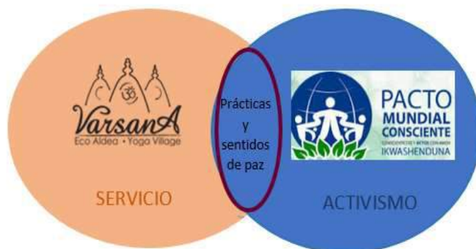
Ilustración 1. Pulido L. (2016). Interés investigativo de la sistematización. Figura.

Adicionalmente, el identificar las prácticas y sentidos de paz que originan una intersección entre el servicio devocional de los devotos residentes de Varsana y el activismo consciente de los participantes de la RPMC, permite abrir campo para “pensarse” y reconocer las acciones que, en la vida comunitaria y cotidiana, están siendo constructoras, mensajeras y multiplicadoras de una nueva cultura de paz. A continuación, se puede observar el contexto general de la experiencia y la problemática específica a partir de la cual se desarrolla la presente investigación: