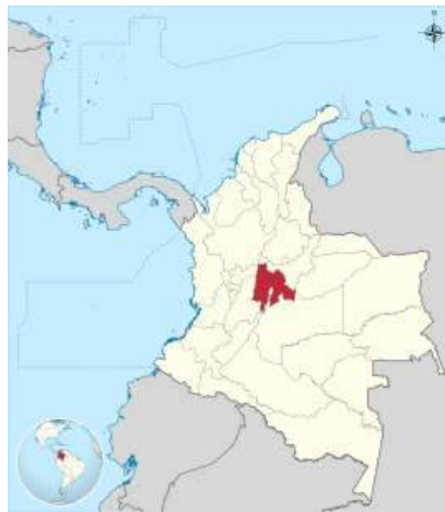
Ilustración 2. 2012. Ubicación de Cundinamarca en Colombia. Mapa.

Geográficamente, se abordó la localización de las acciones de la RPMC únicamente en Colombia, debido a que las acciones promovidas por la RPMC son hechas a nivel global, y es sólo en este contexto nacional donde se identifican los puntos de encuentro y apoyo con las actividades desarrolladas por la Ecoaldea Varsana, que a la vez se sitúa en Granada, Cundinamarca.