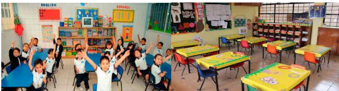
Figura 3: Entorno Educación Preescolar

(...) la vemos en el afán de muchos jardines porque los niños y niñas se preparen rápido para la educación formal, ya que no se puede perder el tiempo. Aquí encontramos el llenado de guías desde los 2 años y a veces desde más temprano; se trata de repetir los números de escribirlos, de aprender a manejar el lápiz desde muy temprana edad, de aprender las vocales y las letras. El desarrollo de la motricidad fina parece ser uno de los principales objetivos. Las tareas para la casa aparecen muy pronto. (Lineamiento Pedagógico y Curricular para la Educación Inicial en el Distrito, 2010, p.19).