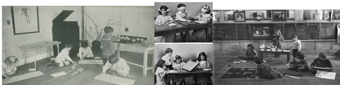
Figura 2: Entorno Educación infantil. Principios del siglo XX

Un escenario inspirado en la educación de las primeras décadas del siglo XX, donde los temas de estudio, como lo exige la psicología infantil, basada en un modelo de desarrollo natural, deben ser elaborados y enseñados de acuerdo con las experiencias del niño y sus necesidades, por lo que los centros de interés se convierten en los espacios para que los niños exploren su medio.