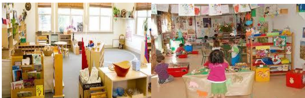
Figura 1: Entorno Educación Infantil. Siglo XXI

lleno de ofertas, o mejor, en un lugar que debe estar lleno de ofertas y la vida infantil un proceso de exploración”. Klaus (2013, p. 252).