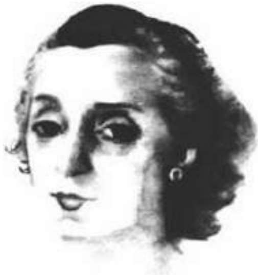
Ilustración 5: Mercedes Rodrigo

A continuación se pueden apreciar dos de las fotos más reconocidas de la Psicóloga y directora del Departamento de Psicotecnia de la Universidad Nacional de Colombia, la primera corresponde al año de 1952 es de pertenencia del psicólogo colombiano Rubén Ardila y la segunda fue tomada en 1949, (Ilustración 5 166 e Ilustración 6 167 ).