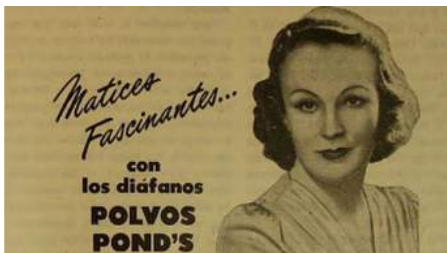
Ilustración 1: Publicidad marca POND'S

Y es que estos anuncios vienen de la industria de cosméticos que intentan responder a una de las nociones más importantes de la época “la felicidad de la mujer” 38 ; esta era una estrategia para configurarla como un sujeto bello, agradable e íntegro a la vista de los demás pues para sentirse plena era fundamental que no tuviera reparos en asumir las diferentes condiciones que tal discurso proponía mientras hacía uso de los múltiples productos para alcanzar tan anhelada meta.