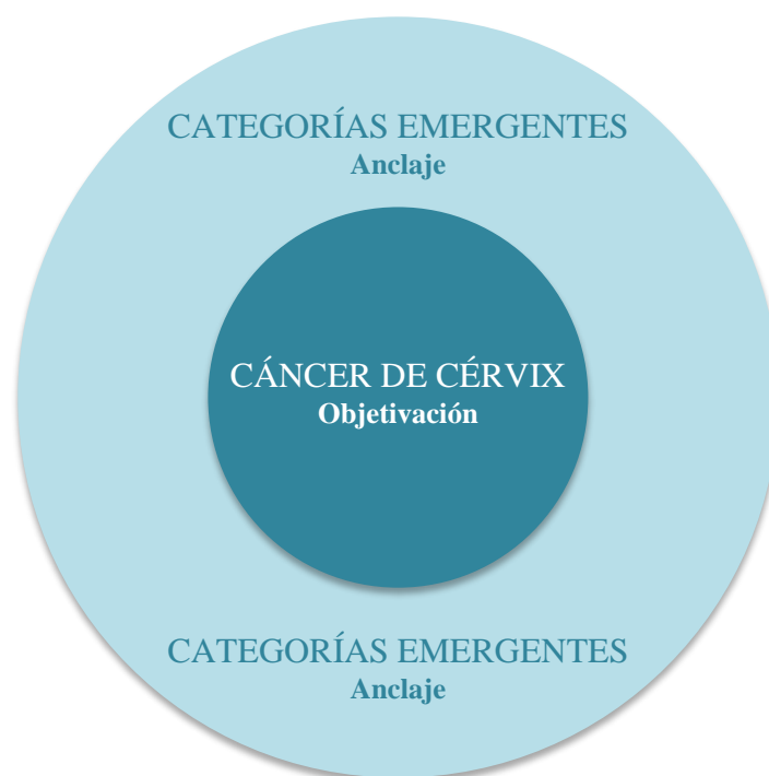
Figura 1 Estructura de una representación social desde la propuesta de Moscovici.

Para establecer las representaciones sociales que tienen las mujeres diagnosticadas frente al cáncer de cuello uterino se aplica el método de Moscovici, el cual consiste en organizar la información recolectada entorno a una objetivación , que está formada por opiniones, creencias, informaciones, etc., que le dan consenso a lo expresado por las participantes frente al objeto de estudio. La objetivación es lo que le da significado a la representación. De ahí se establecen las relaciones con los elementos de anclaje que son las vinculaciones emocionales que emergen de forma verbal como categorías de análisis que acompañan la objetivación (Rodríguez Salazar, 2007, p. 160).