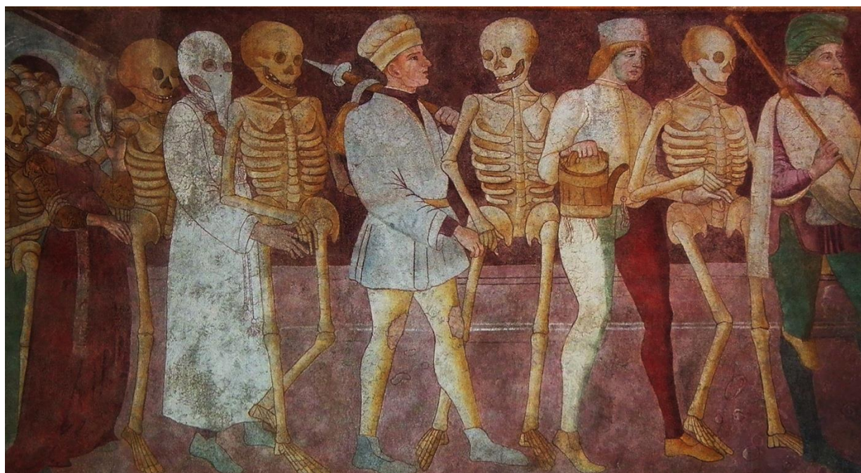
Ilustración 1. Fresco del Oratorio dei Disciplini, Bergamo, Italia.

En la Edad Media nace La Danza de la Muerte o Danza Macabra como un género artístico cuyo tema central es la universalidad de la muerte como acontecimiento humano.