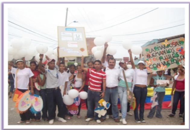
Foto 2. Participando en la construcción de un mundo mejor

En términos de la experiencia particular del proyecto “Niños, Niñas y Jóvenes Constructores y Constructoras de Paz”, el principal factor de ruptura con los ordenes establecidos históricamente en las diferentes comunidades es el mismo ingreso de los jóvenes y las jóvenes al proyecto, ya que este da paso a una sucesión de acciones que buscan el cambio de las condiciones vitales instauradas, pues ha sido a partir de la formación y de la potenciación de los sujetos en sus capacidades críticas, creadoras, comunicativas y políticas, que ellos-as han identificado las posibilidades y características que viabilizan o entorpecen sus desarrollos en pleno ejercicio de sus derechos y de las posibilidades de mundo que se abanicen frente a sus ojos, permitiéndoles desnaturalizar muchas de las prácticas culturales que se encargan de cortar sus sueños de superación del mundo que les contiene.