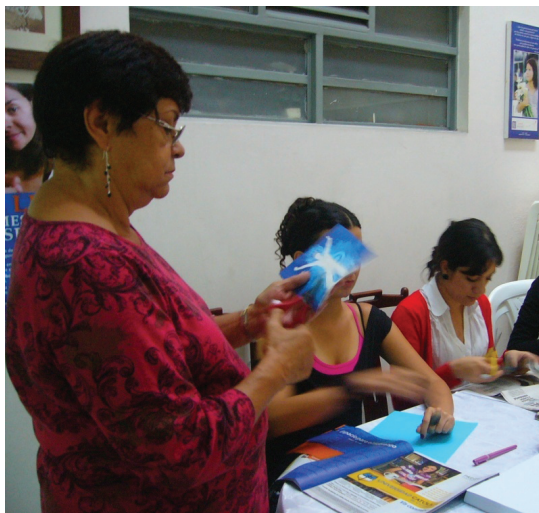
Foto 2: Construyendo el presente. Casa de la Mujer de Pereira, 2010

Joven, juventud y relaciones inter-generacionales son categorías que en el presente texto se asumen trascendiendo un sentido cronológico en