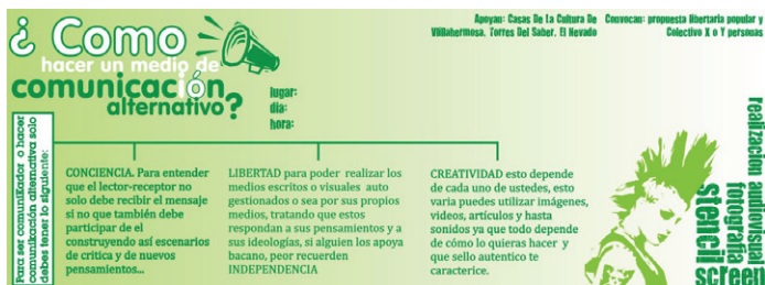
Foto 10. Propuesta Libertaria Popular & Colectivo X ó Y Personas, 2088. Flyer de convocatoria a talleres de comunicación alternativa.

Como ya lo enunciamos anteriormente, la Red gestó junto a algunas Casas de la Cultura de la ciudad de Manizales La Propuesta Libertaria Popular, una iniciativa orientada a generar procesos de formación en comunicación, reflexión crítica y toma del espacio público. Esta apuesta de educación popular fue dirigida especialmente a jóvenes habitantes de barrios, y su quehacer se concentró en la creación-producción de medios alternativos.