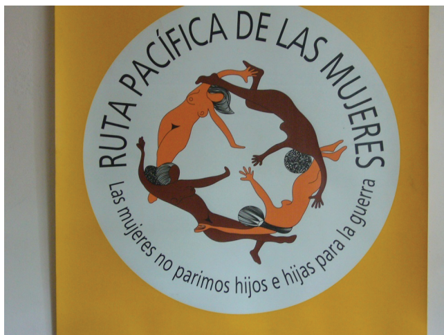
Foto 3: Afiche con consigna significativa de la Ruta Pacífica de las Mujeres