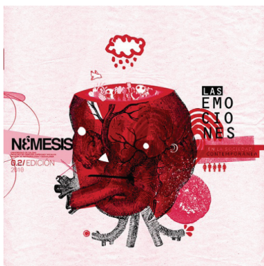
Foto 7. Colectivo Némesis