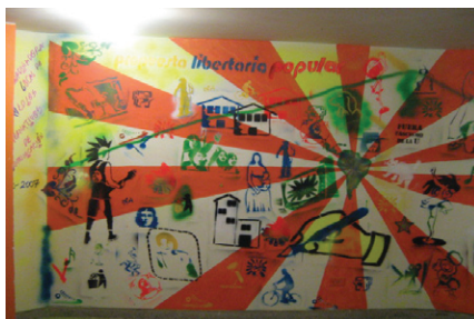
Foto 3. Casa de la Cultura del barrio Villahermosa

La Propuesta Libertaria Popular se desarrolló alrededor de las siguientes áreas de acción: