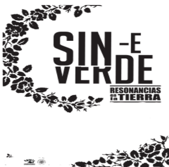
Foto 4. Colectivo Sin-e-verde